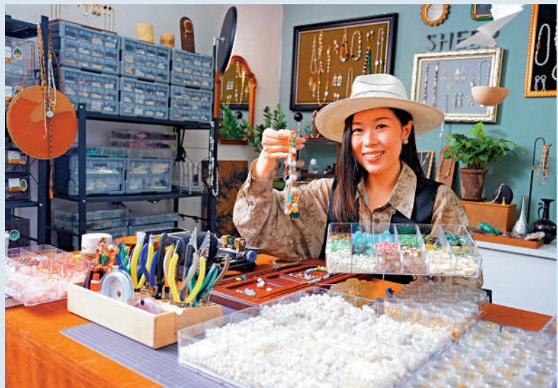
▲明子又表示，香港是做跨境業務非常好的「窗口」，未來將會聚焦跨境市場。