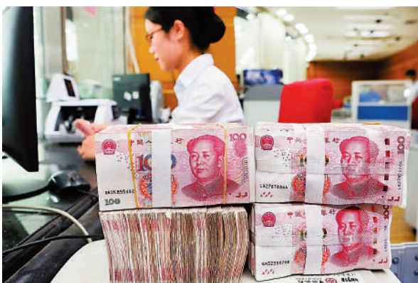
▲近期人民幣兌美元匯率持續走強，專家預期年內可升穿7.1。