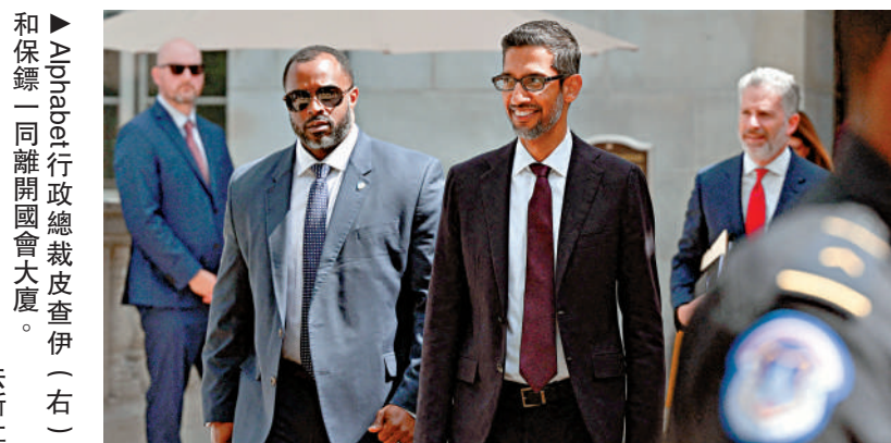
▲Alphabet行政總裁皮查伊（右）和保鏢一同離開國會大廈。

【大公報訊】億萬富豪馬斯克近年頻頻發表爭議性言論，今年又高調表態支持共和黨總統候選人特朗普，在美國國內政治兩極分化的情況下，安全風險不斷升高。美媒稱，馬斯克早期並不重視自身安全，不喜歡有保鏢跟隨，偏好獨自行動。但隨着財富急劇增加，特斯拉董事會要求馬斯克重視安全問題。2014年，馬斯克開始從保安公司GDBA聘請保鏢。