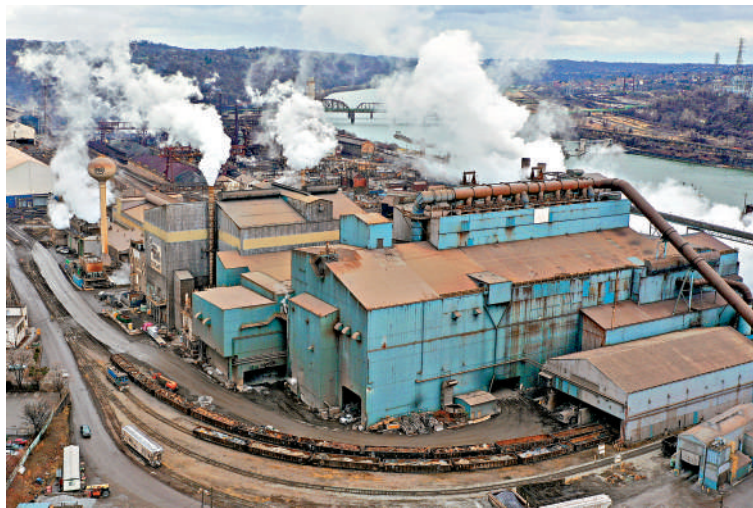
▲美鋼位於賓夕法尼亞州的工廠。

然而，美鋼警告，若收購受阻，美鋼可能關閉位於賓夕法尼亞州的工廠，而該州正是美國大選最關鍵的搖擺州之一，兩黨總統候選人都在爭取該州選票。