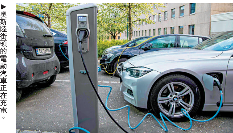
▲奧斯陸街頭的電動汽車正在充電。