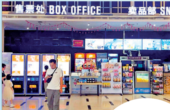
▲今年中秋假期，內地共有約8.5億人次走進影院觀影。