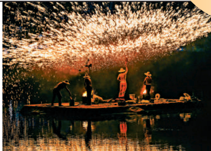
▲16日，在安徽宿州碭山梨山梨園拍攝的打鐵花表演。

國家藝術院團奉獻精彩的線下線上展演，多地演出市場活躍，給廣大觀眾帶來豐盛文化大餐。在北京，中秋假期共舉辦營業性演出281