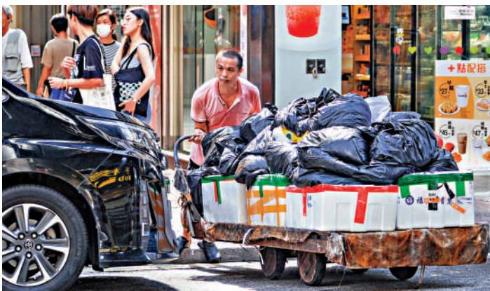
▲香港6月至8月經季節性調整的最新失業率維持3%，就業不足率維持於1.2%的水平。