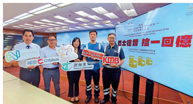
運輸署將於下月主辦「巴士往昔 拾一回憶」巴士巡遊暨展覽，讓市民見證巴士發展，歡度國慶。

巴士展覽費用全免。市民可於今日(20日)上午11時起，經Cityline購票通登記預約參觀日期和時間，名額先到先得，額滿即止。成功登記人士需按選定時段憑二維碼入場，每名入場人士可獲紀念門票一張。巴士巡遊詳情將於稍後公布。此外，在19日起更有「奶龍」巴士遊走大埔，是城巴贊助的期間限定79號巴士，來往粉嶺皇后山至大圍港鐵站，為節日帶來歡樂氣氛。