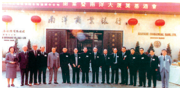
在2003年，南洋商業銀行率先在內地設立分行的外資銀行。

奇跡的印記，令人嘆為觀止。他感嘆，深圳的故事，就是一部新中國生動的時代史詩，激勵着每一個人勇往直前，不斷追求更加美好的未來。