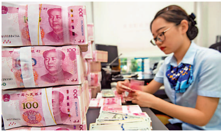
◀人民幣連續十個月維持在全球最活躍貨幣第四位。

A股昨日全線收紅。滬綜指漲0.69%報2736.02點，深成指及創業板指升1.19%及0.85%。滬深兩市成交達到6270億元（人民幣，下同），較前一交易日大增1477億元或30%。