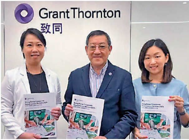
▲致同昨公布香港大型上市公司的ESG調查報告。