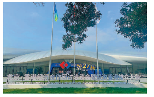
▲京港洽談會將在北京中關村國際創新中心舉行。