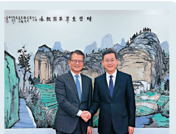
▲陳茂波昨日拜會國家財政部部長藍佛安。