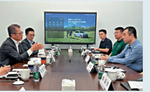
▲陳茂波到內地新能源汽車企業的研發總部，與負責人會面。

在抵達北京後，陳茂波到訪一家內地新能源汽車企業的研發總部，並與負責人會面。該企業已在香港上市，並在特區政府引進重點企業辦公室的牽引下，積極考慮在香港進行部分重點科研項目、設立財資管理中心和貿易結算中心，以及與香港的大學和科研機構展開科研合作。陳茂波表示，香港在人工智能、新能源、新材料等方面都具備優勢，國際資金和研發人才匯聚，鼓勵該企業充分利用香港國際金融和創科雙中心的優勢，在港進行科研合作和拓展國際市場，持續壯大業務。