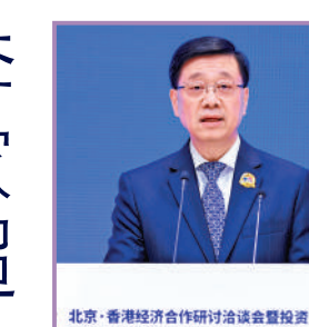
▲李家超向內地企業介紹香港優勢。

中央港澳工作辦公室、國務院港澳事務辦公室分管日常工作的副主任周霽致辭表示，今年以來，香港的金融形勢穩中有進，招商引資引才成效顯著，「事實證明香港一直到现在仍然是全球企業和各類人才投資熱土、創業沃土、築夢樂土。」他希望香港繼續發揮好投資興業的龍頭作用，市場經濟的示範作用，體制改革的助推作用，雙向開放的橋樑作用，先行先試的試點作用，「努力在進一步全面深化改革，推進中國式現代化新征程中培育新優勢，實現新發展，作出新貢獻。」