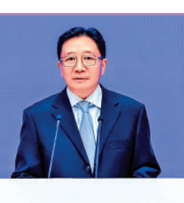
▲周霽表示京港兩地的合作迎來了最佳的時期。

中央港澳工作辦公室、國務院港澳事務辦公室分管日常工作的副主任周霽致辭表示，今年以來，香港的金融形勢穩中有進，招商引資引才成效顯著，「事實證明香港一直到现在仍然是全球企業和各類人才投資熱土、創業沃土、築夢樂土。」他希望香港繼續發揮好投資興業的龍頭作用，市場經濟的示範作用，體制改革的助推作用，雙向開放的橋樑作用，先行先試的試點作用，「努力在進一步全面深化改革，推進中國式現代化新征程中培育新優勢，實現新發展，作出新貢獻。」