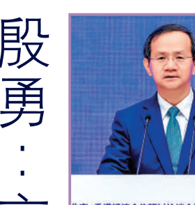
▲殷勇強調京港要加強服務業交流合作，共建開放的新高地。

李家超提到，京港洽談會自從1997年首次舉辦，到現在已來到第27屆，是推進京港經貿合作，特別是招商引資的重要平台，助力兩地在金融專業服務科技，共建「一帶一路」等多個領域實現廣泛合作。「今年的京港洽談會上，首次增設投資香港主題推介活動，重點推介香港的投資機遇和營商優勢，促進兩地企業的交流合作，為京港雙方經濟注入更大動能。」 李家超表示，二十屆三中全會就進一步全面深化改革，推進中國式現代化作出決定，全會指出，要發揮「一國兩制」制度優勢，鞏固提升香港國際金融航運貿易中心地位，支持香港打造國際高端人才集聚高地，健全香港在國家對外開放中更好發揮作用機制。全會也提到要健全因地制宜發展新質生產力體制機制，加強國家戰略科技力量建設，推動科技創新和創業創新融合發展。 李家超指出，香港在「一國兩制」下擁有背靠祖國、聯通世界的獨特優勢，是全球唯一結合中國優勢與世界優勢的城市，也同時為全球金融、航運、貿易與物流中心，且創科實力雄厚，可提供與世界接軌的高水平、高效率的服務。他表示，香港一直在國家改革開放中扮演積極角色，全力對接國家「十四五」規劃、粵港澳大灣區建設、「一帶一路」倡議等國家戰略，主動融入國家發展大局，加快發展新質生產力。 「香港是內地最大的實際利用外資來源地，佔內地外資總額超過五成，去年境外公司的駐港企業數目超過9000家，其中內地駐港企業就有超過2100家，連續六年為數量最多。」李家超表示，北京一直是香港重要合作夥伴，截至去年底香港在北京累計持續投資近1360億美元，佔北京實際利用外資六成半，累計在京設立外資企業的總數逾13000家，佔同類企業總數逾三成半。北京在香港累計協定投資超過300億美元，赴港投資企業超過1900家，在香港上市企業超過200家。 「北京與香港全方位加強合作，優勢互補，有利於更多北京企業發展在香港和全球市場的業務。」李家超表示，越來越多環球企業和人才對香港投信心一票，今年以來投資推廣署已成功協助390間公司在港成立或者是拓展業務，較去年同期上升超過四成，帶來達410億港元的投資額。 他表示，截至8月，創新科技及工業局與引進重點企業辦公室已與超過100家重點創科企業洽談好在香港落戶或擴展業務，將與香港合作投資超過520億港元。特區政府推出一系列招攬人才措施，吸引世界各地人才來港發展，「香港有條件、有優勢引入國家和香港發展所需的國際高端人才」。