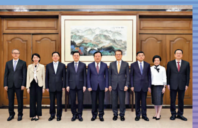
▲夏寶龍昨日在北京會見李家超。周霽、陳茂波等參加會見。 ▲京港洽談會開幕式上舉行重點項目簽約，涉及40項目，簽約金額609.8億元，成果豐碩。