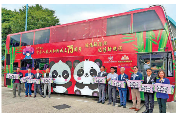
▲以大熊貓作為布置主題的城巴75號線巴士，從昨日起至11月在區內行走。

悠線」及「文青風采線」。其中，「古蹟漁港線」以香港大學為起點，途經伯大尼修院、薄鳧林牧場、華富邨瀑布灣等地，終點站為鴨洲洲洪聖古廟。鄭港涌表示，希望路線有助市民趁假期編排行程、留港消費，亦鼓勵市民將路線推銷給內地遊客。