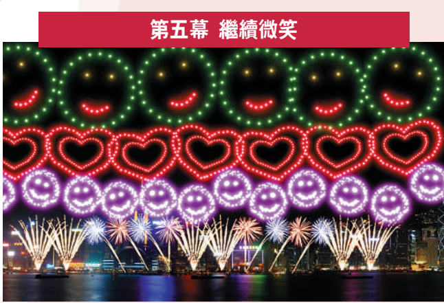
第五幕 繼續微笑 配樂：《繼續微笑》許冠傑 描述：只要有愛，一切高低起伏都能笑着面對。「心心相印」、「笑臉」及「笑臉轉紅心」、「七彩環帶紅心」充滿愛及歡樂，讓觀眾繼續微笑。