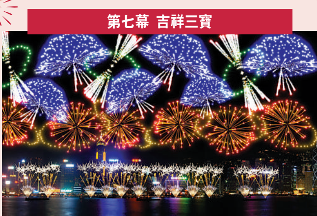
第七幕 吉祥三寶 配樂：《吉祥三寶》吉祥三寶 描述：中國一共有56個民族，包括漢族和55個少數民族。這一幕有各式環形煙花，「煲呔帶環形」、「錦冠環」、「雙環」、「環帶拉手」煙花，象徵着各個民族環環相扣，共融團結。