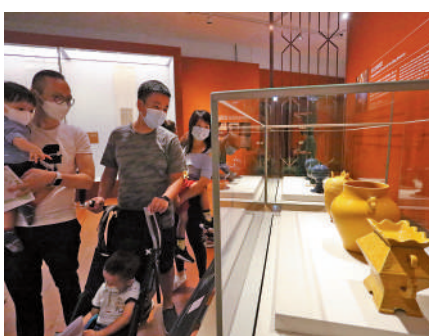
▲香港故宮文化博物館於10月2日至10月7日，延長開放時間為早上10時至晚上8時。