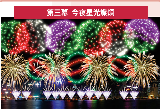
第三幕 今夜星光燦爛 配樂：《The Best NessunDorma》Luciano Pavarotti 描述：香港是聞名的不夜城。日間努力工作，夜間盡情享受生活，隨著夜經濟的出台，夜生活逐漸蓬勃，這一幕以「大錦冠」、「大麗花」、「七彩變球」為主，打出五彩十色煙花。