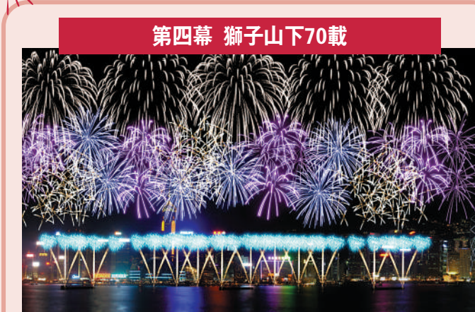
第四幕 獅子山下70載 配樂：《獅子山下》羅文 描述：香港以不朽的獅子山下精神走到今天，一切成果得來不易。我們手牽手就如「紫藍子母彈」、「拉手煙花」及「鐵樹煙花」一般，以堅毅精神攜手邁向下一個里程碑。