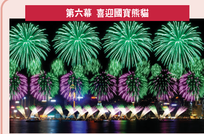
第六幕 喜迎國寶熊貓 配樂：《Kung Fu Fighting》Cee Lo Green 描述：可愛的熊貓就像「銀色椰樹」般在「綠色牡丹」、綠叢中滾動左右奔跑。這一幕充滿熊貓喜歡的食物，有「綠色竹葉」、「綠波」及「綠游星」，市民熱烈歡迎牠們的到來。