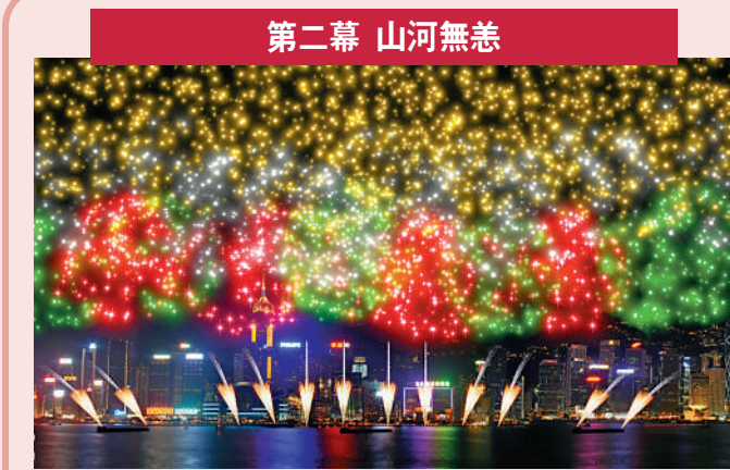
第二幕 山河無恙 配樂：《如願》王菲 描述：祝願各行各業，在不同崗位都能像「紅閃、綠閃、銀閃、金閃及七彩閃光」煙花般閃閃發光，憧憬美好的未來，一切希望都能如願。