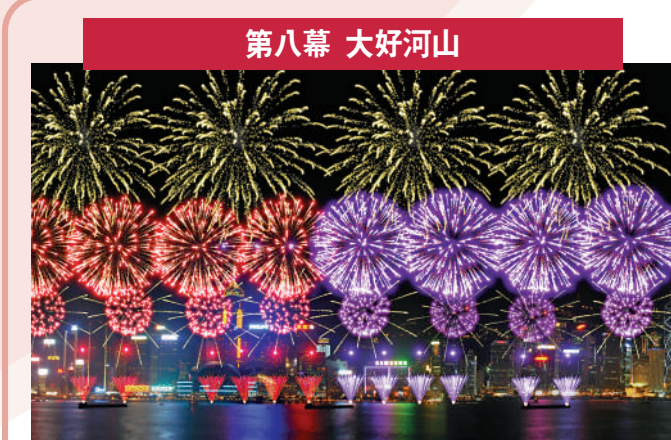
第八幕 大好河山 配樂：《大中國》中國群星 描述：一面有絢麗的「中國紅」，另一面有象徵特區區花高貴的「紫色」左右綻放。最後33秒，以高密度「大哨音」及「華麗錦冠」結尾，祝願祖國繁榮昌盛，國泰民安！