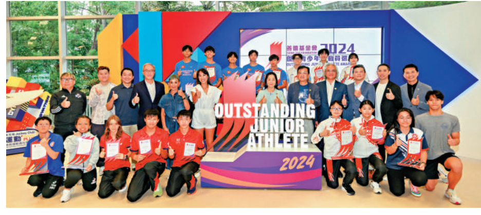
▲獲嘉許運動員及頒獎嘉賓大合照留念。