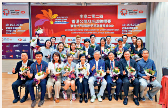
▲港隊名宿在香港公開賽後聚首，為何一鳴送行。