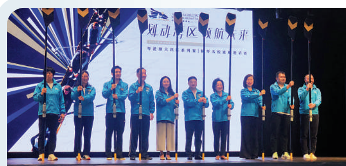
▲AISL哈羅賽艇邀請賽2024暨「粵港澳大灣區系列賽—橫琴名校賽艇邀請賽」官宣啟動。