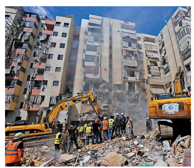
▲以色列21日空襲黎巴嫩貝魯特南部郊區。

【大公報訊】綜合半島電視台、新華社報道：以色列與黎巴嫩真主黨衝突加劇，以軍從20日開始空襲黎巴嫩首都貝魯特，已造成最少31人死亡，包括真主黨一名高級指揮官。這次是以色列和真主黨2006年開戰以來，以軍襲擊貝魯特造成的最嚴重死傷。21日，以色列軍方繼續對黎巴嫩南部真主黨目標展開一輪空襲。黎巴嫩真主黨稱，作為回擊，已經向以色列北部的兩個軍事陣地發射了一批「喀秋莎」火箭彈。以色列軍隊21日稱，連日空襲已「幾乎完全瓦解」真主黨領導層。以軍在X網站上表示：「真主黨的軍事指揮鏈幾乎被完全瓦解。」在以軍貼出的真主黨組織指揮架構圖中，除了最高領導人納斯魯拉外，下面八個名字中，有六人已被「清除」。與此同時，以色列在加沙地帶的打擊行動並未停止。加沙地帶衛生部門21日說，以軍21日轟炸加沙地帶北部加沙城一所學校，造成至少22人死亡、30人受傷。遇襲學校收容了大量流離失所民眾，死傷者中大部分是兒童和婦女。聯合國安理會20日就以黎最新局勢召開緊急會議。中國常駐聯合國代表傅聰在會上表示，中方對黎以局勢可能進一步升級深表擔憂。傅聰說，當前中東地區局勢岌岌可危，以色列在加沙地帶的軍事行動仍在持續，已奪去4萬多巴勒斯坦民眾的生命。以色列同時還在不斷加劇黎以邊境地區的緊張局勢。中方特別呼籲以色列放下使用武力的執念，立即停止在加沙地帶的軍事行動，立即停止侵犯黎巴嫩主權和安全的行為，立即停止可能將地區拖入新的浩劫的冒險行徑。中方強烈敦促以色列有影響力的國家拿出實際行動，制止以色列在錯誤的道路上越走越遠。