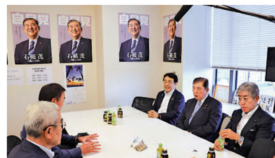
▲石破茂(右排中央)民調支持率位居前列。網絡圖片

自民黨總裁選舉定於27日舉行投票和計票，該黨367名國會議員每人一票，各地黨員黨友的支持率折合為367張地方票，合計734票，得票過半者當選。若首輪投票無人得票過半，前兩名將進行第二輪投票。日媒預測，首輪投票很可能無法決出勝負。第二輪投票中，地方票減少至47張，國會議員的支持將成為關鍵。