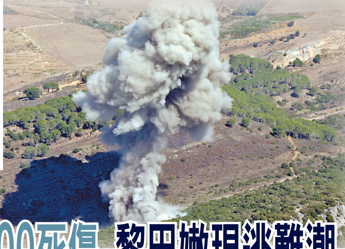
▶以軍24日繼續在黎南部狂轟濫炸。