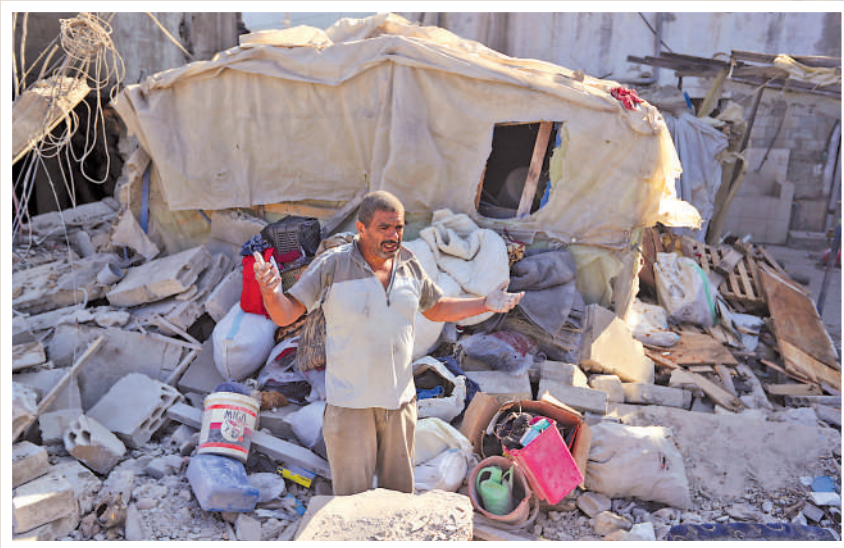
▲黎巴嫩南部村莊24日遭以軍空襲，房屋化為廢墟。

以色列23日對黎巴嫩發動大規模空襲，打擊約1600個目標，造成至少558人死亡，1835人受傷。以方聲稱，黎巴嫩真主黨將武器藏在民宅內，並以此為藉口，警告黎南部和東部民眾，要求他們盡快離家。數以萬計的黎巴嫩人被迫北遷，逃難車潮引發交通堵塞。聯合國難民署表示，黎巴嫩平民傷亡慘重，令人無法接受。中國外交部發言人林劍24日表示，中方反對和譴責一切傷及無辜平民的行動。