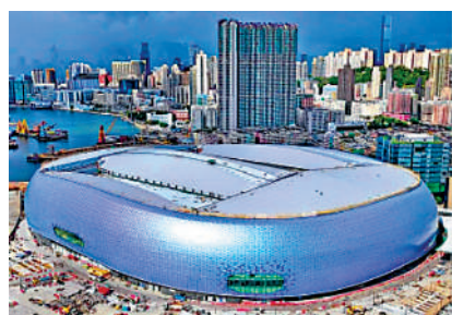
▲啟德體育園啟用後可以帶動旅遊業等產業。

李家超又表示，體育園將於明年第一季舉辦盛大開幕活動，目前已有50多間公司或團體回覆，有興趣在體育園安排項目，期待有更多本港體壇明星參與開幕表演。