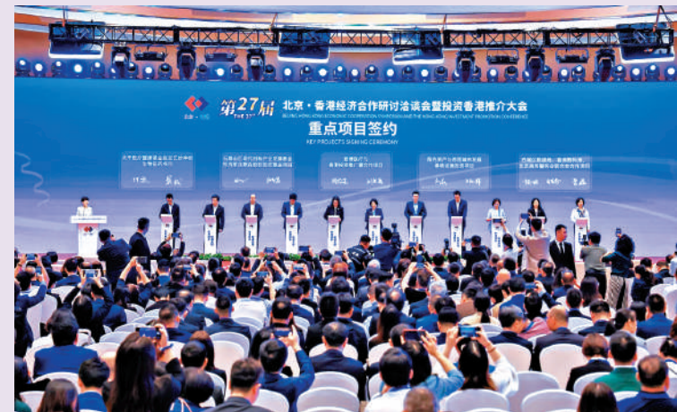
▲內地與香港加強產業合作，京港洽談會成果豐碩。