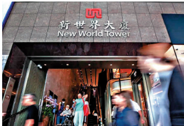
▲新世界發展表示，未來營運方針不變，重點發展地產業務。

資料顯示，新世界透過全資附屬公司持有啟德體育園75%股權，餘下25%股權由同系的新創建（00659）持有。