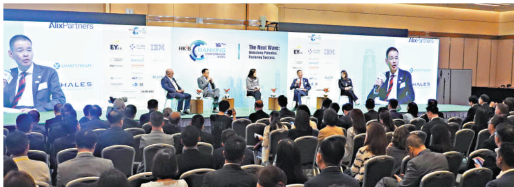
「香港銀行家峰會2024」昨日在香港舉行。

黃偉綸指出，是次排名上升對特區政府而言尤為鼓舞，體現了近年為促進香港金融服務業所做的努力及舉措方向正確，並已取得成果。峰會上，他引用行政長官李家超所述「沒有最好，只有更好」來表明態度，認為香港不難追上倫敦。