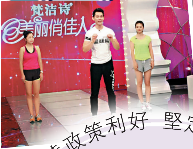
台灣青年馬克(中)在大陸參加節目《美麗俏佳人》的錄製，傳授減肥秘笈。