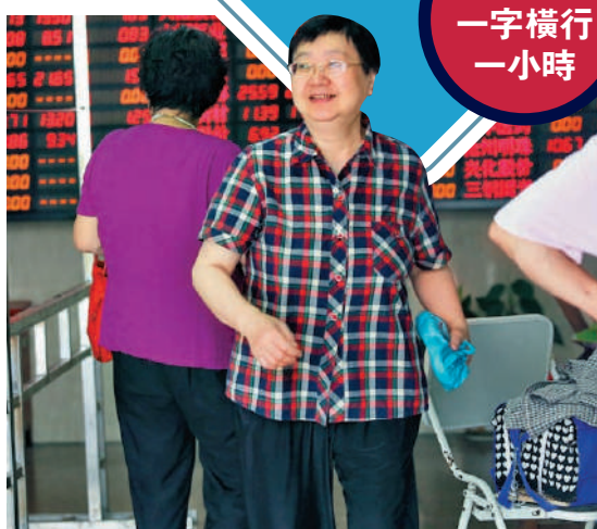
▲▼A股連日大漲，市場的觀望情緒一掃而空，投資賬戶開戶數激增，股民大賺。