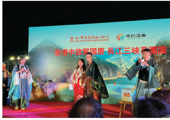
郵輪上舉行的晚會活動。