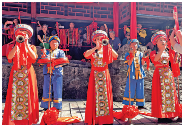
三峽人家裏的土家族哭嫁表演。

「哭嫁」習俗源於古時女子婚姻不自由，土家族女子只好在婚前大聲哭唱，寄託對婚後生活的憂慮、表達對封建婚姻的不滿。而現在更多的是以哭來訴說父母之恩、姐妹之情，表達對親人的不捨。在婚嫁樓，大家近距離觀看「哭嫁」表演，演員會上前與觀眾互動，表演有笑有淚。