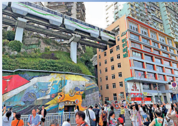
重慶李子壩輕軌「穿樓」景觀。