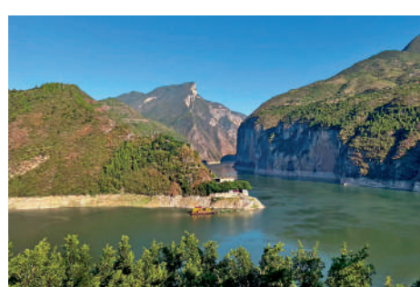
夔門位於重慶奉節縣。

巫山神女溪位於巫峽南岸，遊客們乘坐觀光船穿行在青山綠水間，抬頭可見山連綿不絕，一座座高峰映入眼簾。這裏未被深度開發，保留着原生態的自然景觀，溪水澄澈碧綠，山上鬱鬱蔥蔥，陽光不時穿過峽谷，照射在水面波光粼粼。為我們介紹神女溪的劉導遊是土生土長的本地人，唱得一手好山歌，一開口，悠揚高昂的歌聲便吸引了大家的注意。有人提問，為什麼當地人都會唱山歌，而且嗓門如此嘹亮？劉導遊笑說：「可能是因為我們從小大聲喊媽媽回家吃飯，聽起來像是唱歌。」