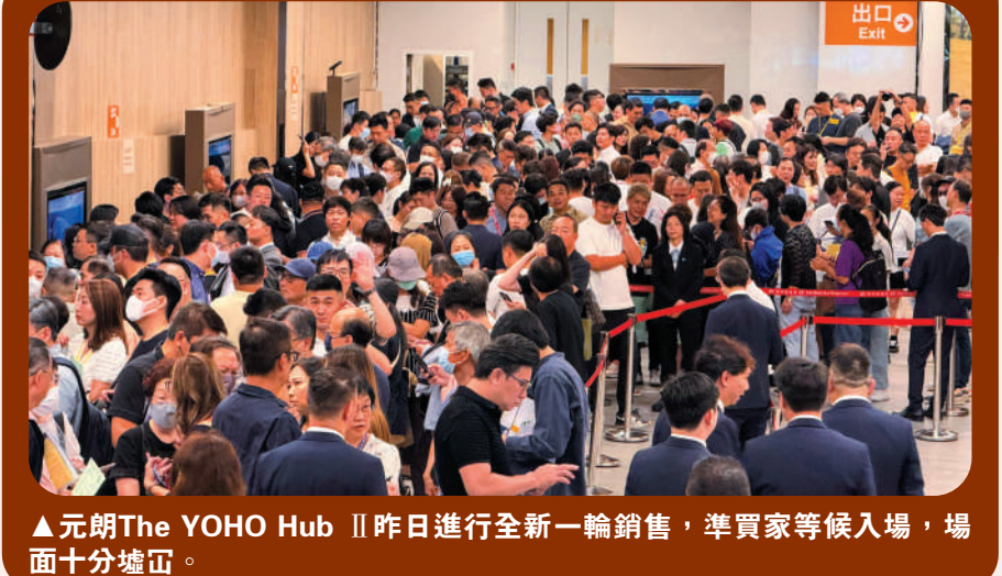
▲元朗The YOHO Hub II昨日進行全新一輪銷售，準買家等候入場，場面十分火爆。

本港銀行減息及中央連環推出利好經濟政策帶旺股市，本港樓市亦起舞，昨日兩個新盤同收旺場。英皇國際（00163）跑馬地ONE JARDINE'S LOOKOUT挾同區13年新盤出擊，推售的85伙四句鐘閃電搶清，研加推尚餘單位應市；另外，新地（00016）元朗The YOHO Hub II開賣全新第6座120伙，全日沽112伙或93%。綜合市場消息，在兩新盤力撐下，昨日一手市場共賣近220伙，料是近兩個月最旺的周末。