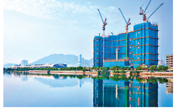
▲柏蔚森II突擊上載155伙的價單，並於周二發售。