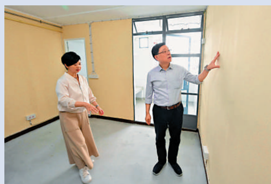
▲李家超（右）在房屋局局長何永賢（左）陪同下，視察沙田區內的翻新公屋單位。 ▲李家超（前排右二）到訪沙田邨內的熟食檔，與市民交流。