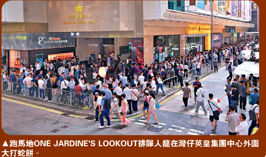
▲跑馬地ONE JARDINE'S LOOKOUT排隊人龍在灣仔英皇集團中心外圍大打蛇餅。

本港銀行減息及中央連環推出利好經濟政策帶旺股市，本港樓市亦起舞，昨日兩個新盤同收旺場。英皇國際（00163）跑馬地ONE JARDINE'S LOOKOUT挾同區13年新盤出擊，推售的85伙四句鐘閃電搶清，研加推尚餘單位應市；另外，新地（00016）元朗The YOHO Hub II開賣全新第6座120伙，全日沽112伙或93%。綜合市場消息，在兩新盤力撐下，昨日一手市場共賣近220伙，料是近兩個月最旺的周末。