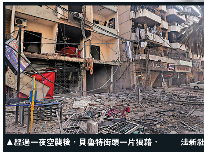
▲經過一夜空襲後，貝魯特街頭一片狼藉。