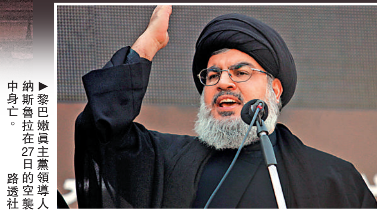
▶黎巴嫩真主黨領導人納斯魯拉在27日空襲中身亡。