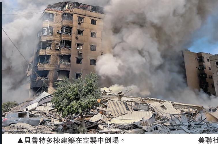
▲貝魯特多棟建築在空襲中倒塌。