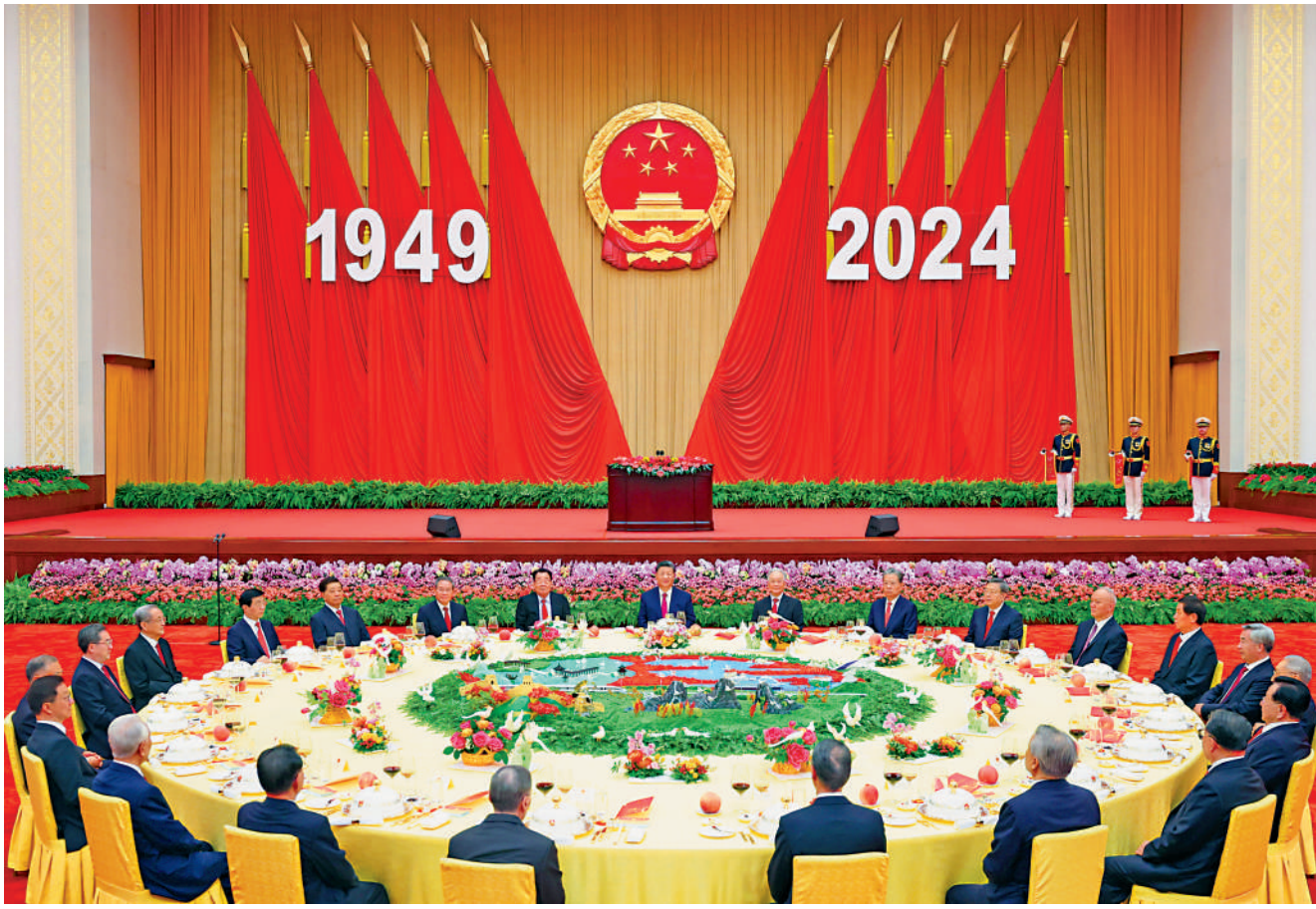
►9月30日晚，慶祝中華人民共和國成立75周年招待會在北京人民大會堂隆重舉行。習近平、李強、趙樂際、王滬寧、蔡奇、丁薛祥、李希、韓正等黨和國家領導人與約3000名中外人士歡聚一堂，共慶新中國75周年華誕。