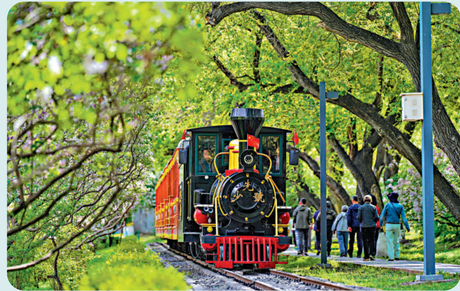
▲哈爾濱兒童公園的小火車。

不過，我更感興趣的是人。有了現實的人，靜態的山水和古蹟才有意義。西寧人民公園東門，兩組相鄰廣場舞各有領隊，引得後排看熱鬧的人都躍躍欲試。哈爾濱江畔公園，十來個大叔大媽，繡金絲小黑帽、蝴蝶紋長褶裙，跟隨《我們新疆好地方》俯身揚眉，揮臂聳肩，悠悠悠一步一顛，一頓一旋。蘭州白塔山腳一處園廊中，八九對中老年人也跳新疆舞蹈，小白帽、黑鑲邊坎肩，一曲終了就換個舞伴繼續。在銀川，寧園的一側有涼亭石棧，六七位老人家伴着懷舊金曲學跳快三、慢三；覽山公園周末人山人海，山下遊樂場釣魚、射箭、套圈、電競，大型跳樓機每次突降就激起尖叫的巨浪，旁邊的夜市煙