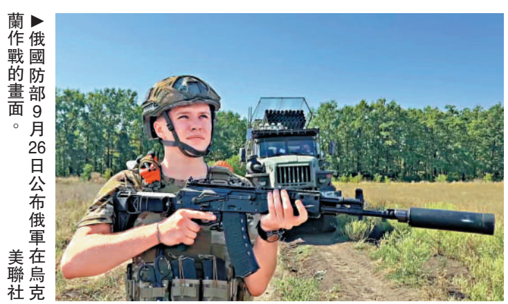
▶俄國防部9月26日公布俄軍在烏克蘭作戰的畫面。

斯仍相距甚遠，基輔很大程度上依賴西方援助。俄羅斯1日開始秋季徵兵，持續至12月31日。根據俄總統普京9月30日發布的命令，預計將有13.3萬人參軍，比今年春季徵兵多3000人。新兵服役期為12個月，不會被派遣參與烏克蘭特別軍事行動。俄羅斯武裝力量總參謀部組織動員總局局長布爾斯金斯基說：「我想指出，過去和現在的徵兵活動與特別軍事行動毫無關係。」