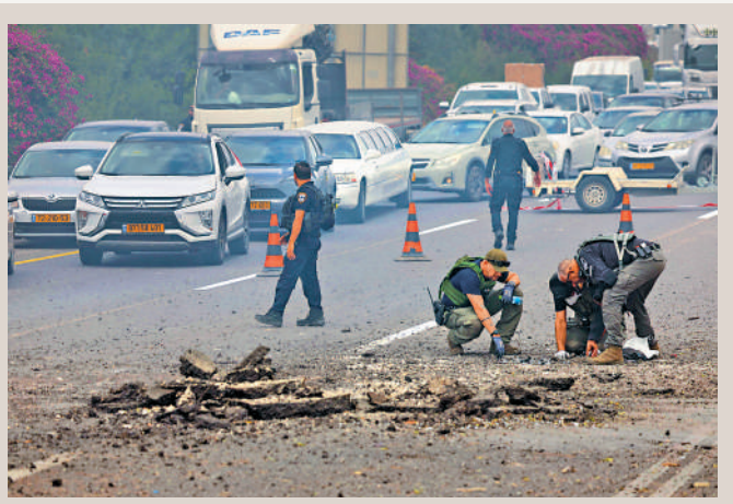
▲以色列中部1日遭到來自黎巴嫩的火箭彈襲擊。