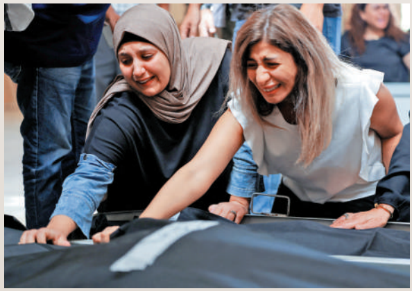
▲黎巴嫩民眾1日哀悼死於以軍襲擊的親友。

以軍1日對黎巴嫩展開地面行動，受到國際社會譴責。但美國依然表態支持以色列。五角大樓稱，美防長奧斯汀和以防長加蘭特通電話，就「有必要拆除黎以邊境的真主黨軍事設施」達成共識。以軍日前空襲黎首都貝魯特，