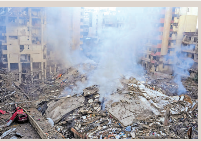
▲以軍1日再次空襲貝魯特南郊。

布，英國政府包下一趟航班，向希望離開黎巴嫩的英國公民提供幫助。航班預計將於2日從貝魯特機場起飛，在黎英國公民及其配偶或伴侶、18歲以下子女均可申請乘坐該航班離開。加拿大外長喬利說，加政府已確保額外預留800個航班座位，以便加拿大公民及其直系親屬離開黎巴嫩。