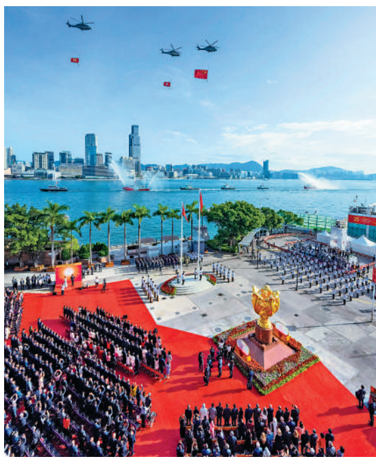
▲昨日在金紫荊廣場舉行的慶祝中華人民共和國成立七十五周年升旗儀式上，紀律部隊和飛行服務隊在海上和空中敬禮。