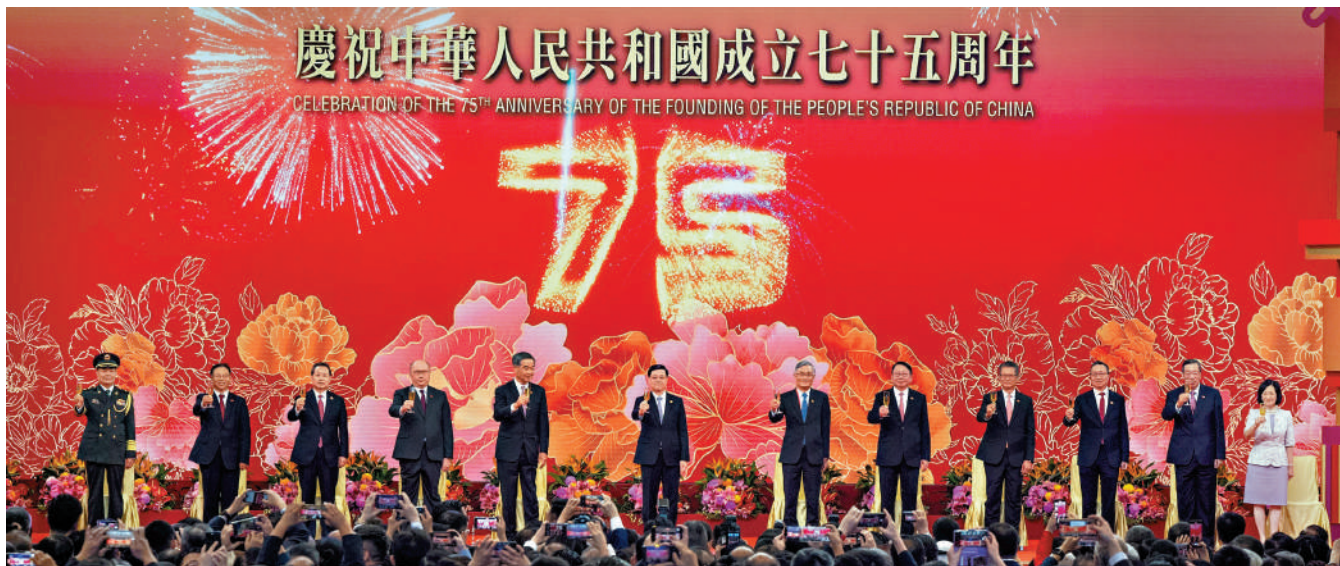
◀香港特別行政區政府昨日在會展舉行國慶酒會，歡慶中華人民共和國成立75周年。

香港全城昨日喜氣洋洋，歡度國慶。大街小巷的國旗、區旗迎風飄揚。18區活動亮點紛呈，機構團體慶祝活動熱烈繽紛；零售、戲院、商戶企業與交通機構提供各類優惠。市民各適其適，一家大小歡度節日，同心祝願祖國繁榮昌盛，香港社會安定，經濟蓬勃發展。