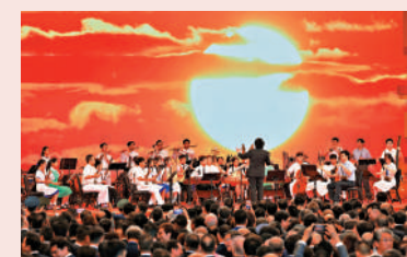
▲由多間本地中學學生組成的聯校中樂團，在國慶酒會上唱響對祖國的熱愛。

百年等每一個國家榮耀時刻，這一曲旋律，傾訴著數代華兒女心聲，是對祖國最深情的告白，激勵著一代代中華兒女奮發向上。當最後一個音符落下，現場爆發熱烈掌聲，這掌聲不僅是對樂手精湛表演的肯定，更是對這場音樂表現所傳達的愛國情感的有力回應。大公報記者 吳俊宏