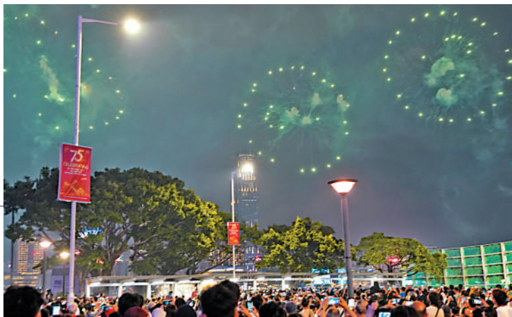
►大匯演其中一幕拼出「笑臉」等圖案，期望帶給觀眾愛及歡樂。