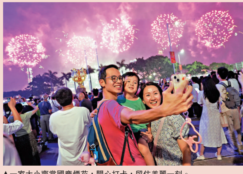
▲一家大小齊賞國慶煙花，開心打卡，留住美麗一刻。

絢麗的國慶煙花於昨晚在維多利亞港上空綻放，將熱烈的節慶氣氛推至最高潮，33萬名市民及遊客在維港兩岸欣賞，人潮提前幾小時到達尖沙咀海旁，期待佔到欣賞煙花最佳視角的好位置。晚上全程約20分鐘的煙花不斷變換出「紅色五角星」、「笑臉」及「竹葉」等圖案，現場人群發出陣陣歡呼，大家舉起手機，共同記錄下煙花的精彩時刻。