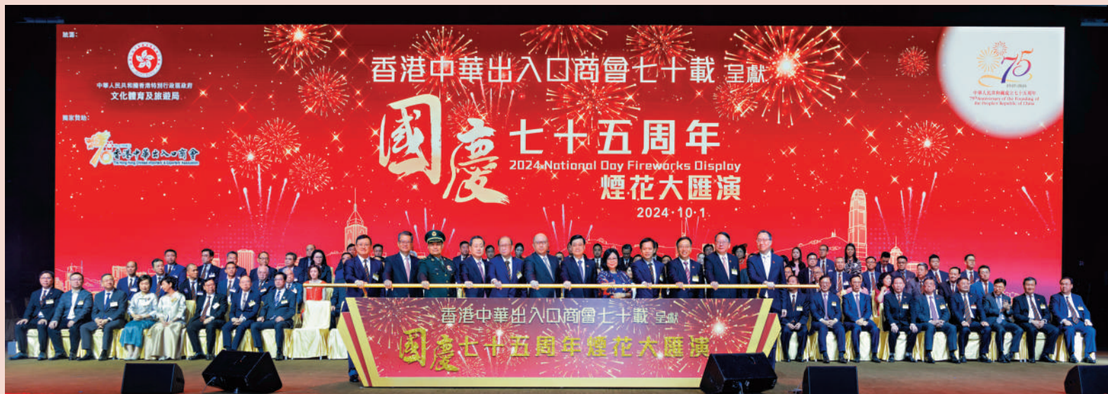
▲國慶煙花大匯演昨晚舉行，一眾嘉賓合影。