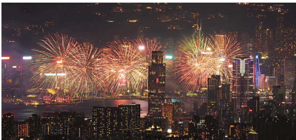
▲國慶煙花大匯演全程約20分鐘，共有八幕，幕幕精彩，令市民留下難忘回憶。