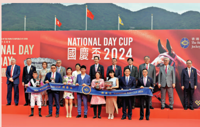
▲國慶盃頒獎儀式大合照。