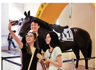
▲馬迷與「金鎗六十」銅像拍照。

香港一代馬王、獲得無數榮譽的「金鎗六十」於上月底退役，結束其在港5年多的傳奇競賽生涯。不過，這匹在本港甚至國際馬壇上取得卓越成就的良駒，仍然人氣不減，其位於沙田馬場內的銅像大受歡迎，馬迷爭相與銅像拍照，務求以另類方式留下美好的回憶。