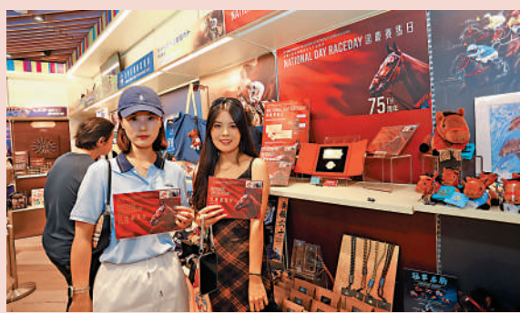
▲昨天入場人士在沙田馬場的「馬場有禮」商店，盡享國慶賽馬日的豐富禮遇，同賀國慶。