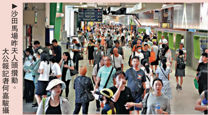
▲沙田馬場昨天人頭攢動。