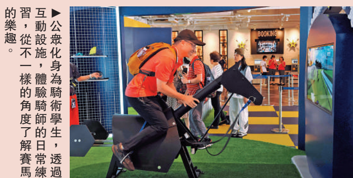
▲公眾化身為騎術學生，透過互動設施，體驗騎師的日常工作，從不一樣的角度的了解賽馬的樂趣。