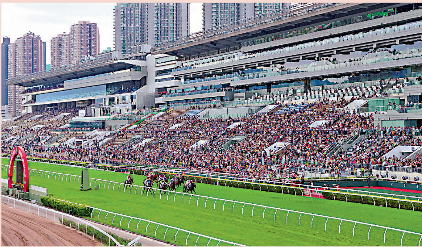
▲昨天國慶賽馬日，兩個馬場共吸引近二萬五千名觀眾入場。

為共享節日的歡樂氛圍，昨天市民及遊客均可免費進入沙田馬場公眾席。除精彩賽事外，沙田馬場還特設多個打卡熱點和互動活動，包括特色手繪藝術牆、VR虛擬遊覽香港賽馬會從化馬場、騎師體驗訓練等，希望於共賀國慶的同時，為入場者帶來匯聚賽馬、體育及娛樂的豐富體驗。