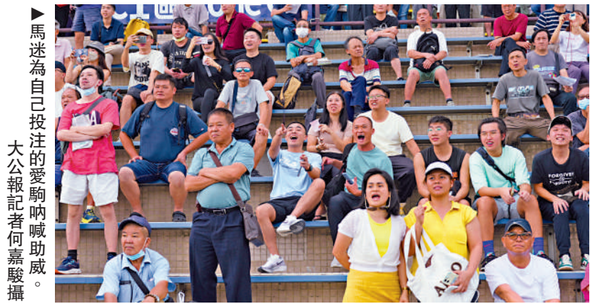
馬迷為自己投注的愛駒吶喊助威。

為慶祝中華人民共和國成立75周年，香港賽馬會昨天在沙田馬場舉行國慶賽馬日。國慶日洋溢着濃厚節日氣氛的沙田馬場人頭攢動，連同跑馬地馬場，兩個馬場吸引近25000名觀眾到場，當中包括逾5200名內地遊客。在焦點賽事的「國慶盃」，最終由「美麗第一」勝出。馬會表示，昨天的投注額15.68億元，較去年同期增長了7.5%。 大公報記者 張銳