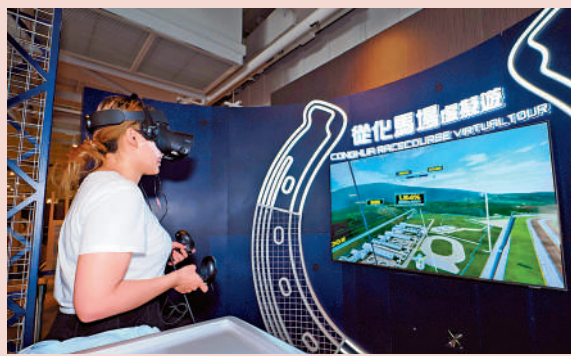
▲馬迷透過VR虛擬遊覽，由高空俯瞰從化馬場的壯麗景色，並以第一身視角遊覽世界級馬匹訓練設施。