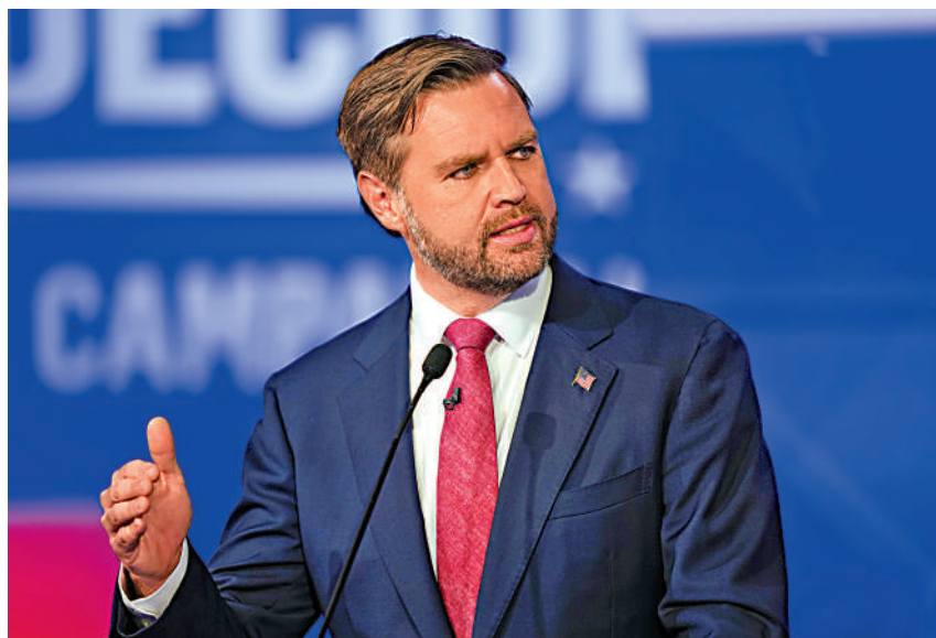
共和黨副總統候選人萬斯1日在紐約參加辯論。

當地時間1日，美國共和黨副總統候選人萬斯和民主黨副總統候選人沃爾茲在紐約舉行電視辯論。這很可能是11月大選之前兩黨候選人之間的最後一場公開辯論。美媒認為，與此前火藥味十足的總統候選人辯論不同，此次辯論回歸「正常」，雙方更專注於政策而非人身攻擊，選後民調顯示，觀眾認為兩人表現難分明顯勝負。但兩黨在移民、墮胎等議題上仍嚴重對立，且萬斯拒絕承認特朗普在2020年選舉中落敗，令選民擔憂大選後再次發生政治暴力事件。