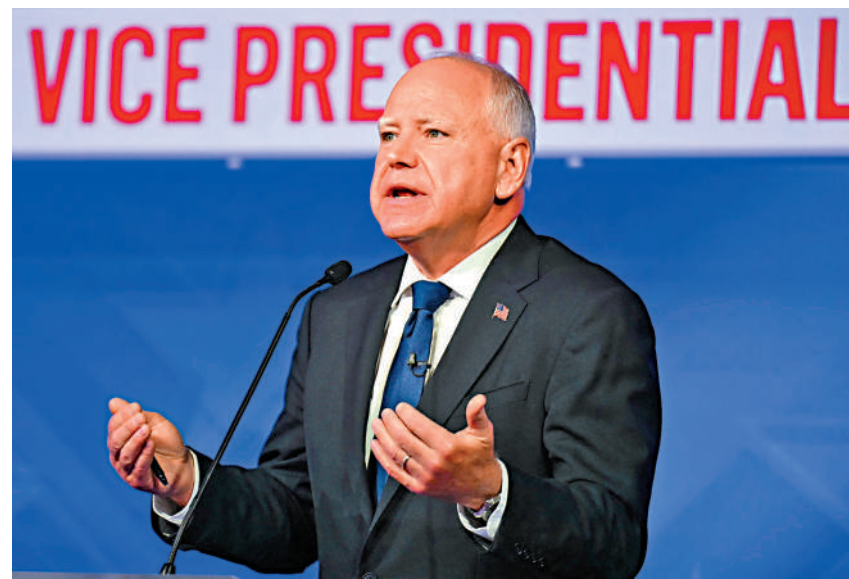
民主黨副總統候選人沃爾茲與萬斯針鋒相對。

【大公報訊】當地時間1日晚9時，萬斯和沃爾茲在哥倫比亞廣播公司（CBS）紐約演播室舉行副總統候選人辯論。副總統辯論對大選結果的影響通常不大，但今年美國總統拜登與前總統、共和黨總統候選人特朗普辯論一次後宣布退選，接替拜登參選的哈里斯目前也只與特朗普辯論了一次，此次副總統辯論受到更多關注。