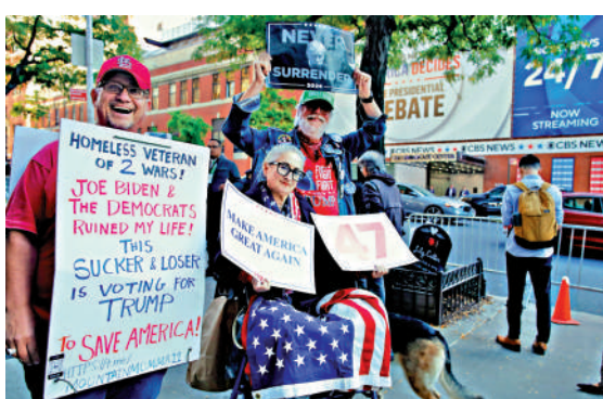
▲特朗普和萬斯的支持者1日在辯論會場外聚集。

根據此前商定的規則，萬斯和沃爾茲的麥克風在辯論全程均打開，但在談到移民問題時發生一個