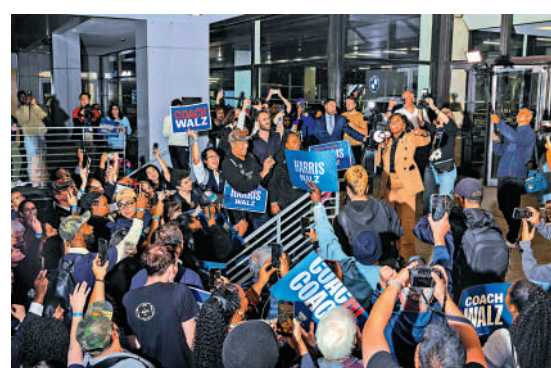
▲哈里斯和沃爾茲的支持者1日為沃爾茲助威。