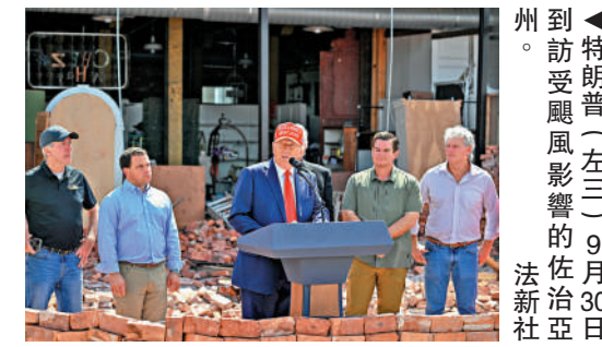
▲特朗普（左三）9月30日到訪受颶風影響的佐治亞州。

與此同時，佐治亞州和另一個搖擺州北卡羅來納州受颶風「海倫妮」重創，救災成為拉票手段。哈里斯2日前往佐治亞州視察災情，未來幾天還將趕赴北卡州。特朗普已訪問了佐治亞州的重災區。特朗普在2020年大選中以微弱優勢在北卡州勝出，如今他在該州的民調支持率領先哈里斯不到一個百分點。