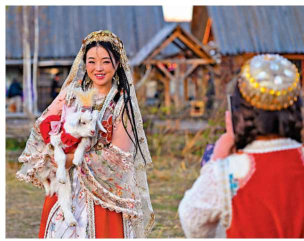
▲10月2日，遊客身著民族服裝在新疆阿勒泰禾木村打卡拍照。

同時，當地還推出了劇中同款「碎碎酒」、「文秀奶奶」同款服飾；旅行社結合劇情，推出阿勒泰夏牧場牧民體驗一日遊、喀納斯景區兩日遊等多條旅遊線路……一系列舉措，讓旅行更有故事，讓「詩和遠方」具體可見。