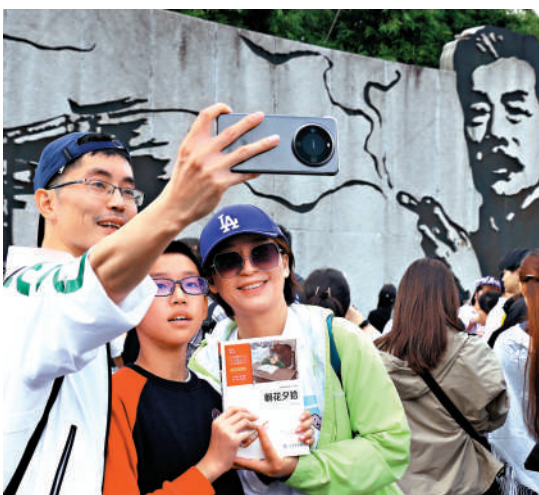
人文遊 浙江紹興·魯迅故里