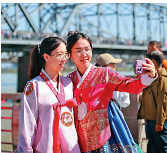
邊境遊 遼寧丹東·中朝邊境