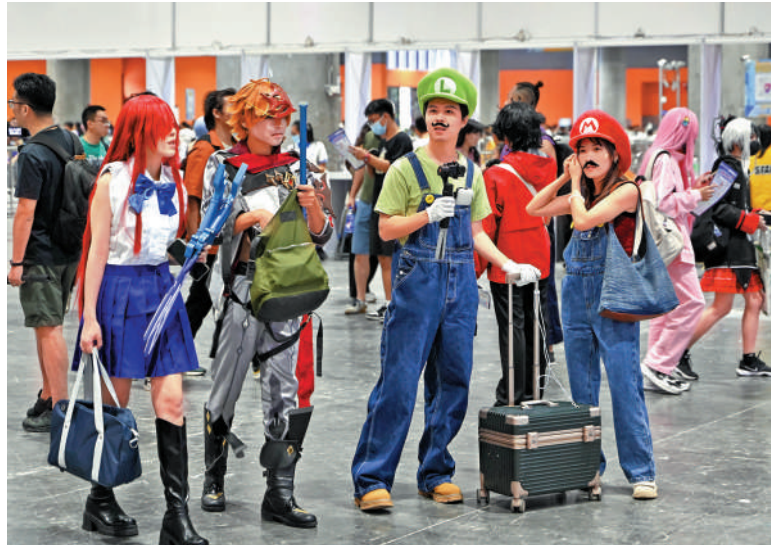
▲10月2日，動漫遊戲愛好者打扮成動漫遊戲形象參加第十七屆中國國際漫畫節動漫遊戲展。中新社

在四川成都，天府國際動漫城連續七天舉辦國慶動漫嘉年華。有遊客表示，除了逛漫展、購買喜歡的動漫周邊外，最大的驚喜是日常在動漫電影、動漫書中才見到的動漫形象都來到了動漫城，火影忍者、蜘蛛俠、大黃蜂、無臉男、聖鬥士星矢等形象隨處可見。