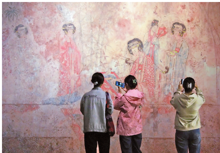
▲10月1日，遊客在遼寧省博物館觀看展覽。

與此同時，傳統觀光旅遊的「走馬觀花」已經難以滿足遊客的消費需求，非遺正在成為遊客感受各地文化的重要觸手。到福建泉州蟳埔體驗簪花、到吉林延吉體驗朝鮮族服飾的民族風情、在江蘇南京感悟秦淮燈船的國潮韻味……「非遺+旅遊」使遊客不再僅僅是觀賞者，而能親身投入到各類活動中，作為參與者領略中華優秀傳統文化的博大精深與獨特魅力。