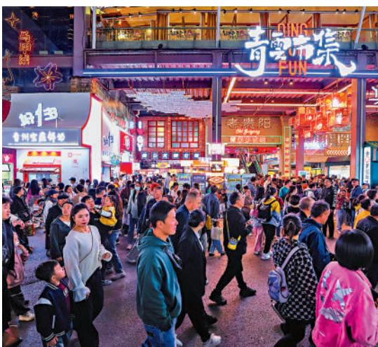
夜景遊 貴州貴陽，青雲市集