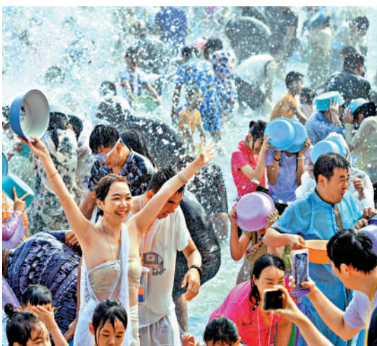
風情遊 雲南西雙版納·傣族潑水節