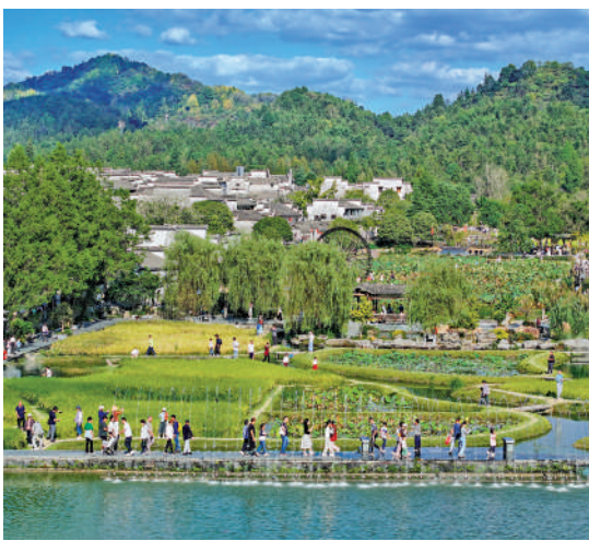
古村遊 安徽黃山，西遞古村落