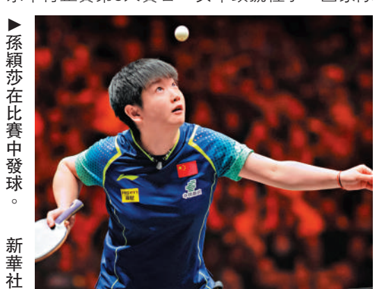
▲孫穎莎在比賽中發球。

【大公報訊】記者張銳報導：世界乒乓球職業大聯盟（WTT）中國大滿貫賽，昨天在北京舉行正賽第5天賽日。女單頭號種子、國家隊