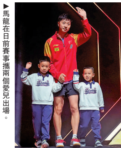
▲馬龍在日前賽事攜兩個愛兒出場。

此外，上一場比賽結束後，馬龍曾經透露，本屆中國大滿貫賽或許是自己最後一次國際賽事，目前還在一個思考的階段，「大滿貫落戶到北京，對自己而言有一種特殊的情感。參加完奧運會之後，特別想着帶家人來北京體驗一次大滿貫，確實也把北京大滿貫當作自己最後的國際賽事了。」