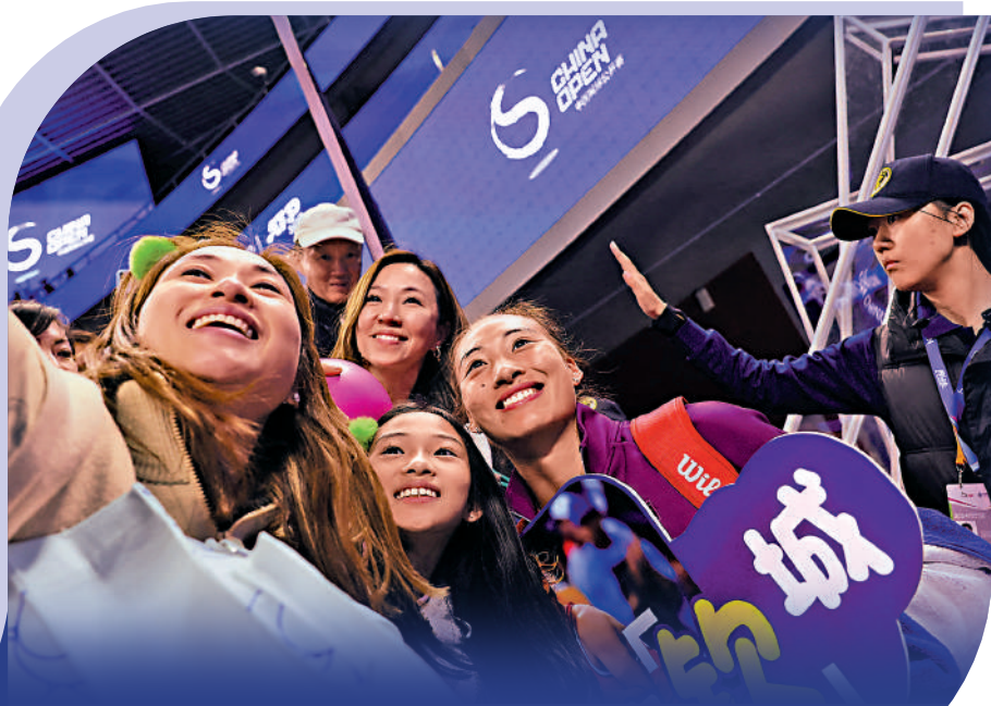
▲鄭欽文（右二）與粉絲合照。