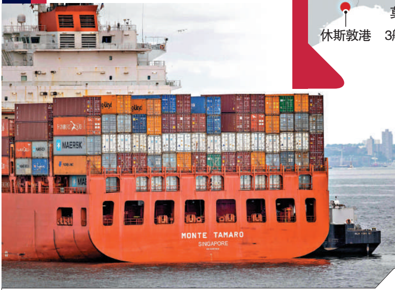
罷工港口貨櫃運量