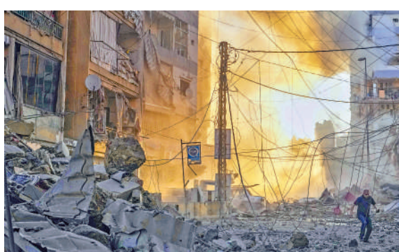
▲以色列4日轟炸黎巴嫩首都貝魯特，民眾匆忙逃生。

黎巴嫩交通部長哈米耶4日表示，當天上午，以色列在黎巴嫩與敘利亞交界的馬斯那過境點附近發動空襲，切斷了連接兩國的主要國際公路。據黎巴嫩政府統計，過去10天已有逾30萬人從黎巴嫩跨境進入敘利亞，躲避以色列的空襲，其中大部分是敘利亞人。以軍發言人此前聲稱，真主黨利用這一