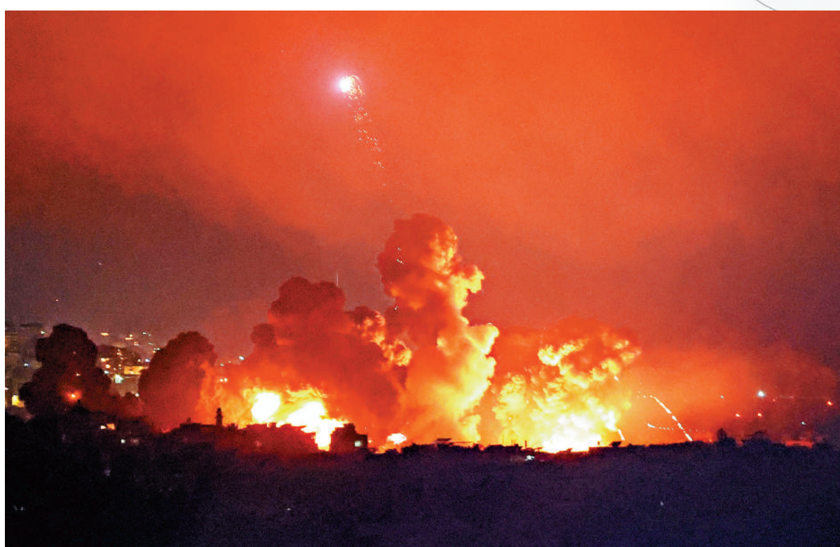
▲以色列3日晚持續轟炸黎巴嫩首都貝魯特南郊，升起巨大火球和滾滾濃煙。

以色列3日晚間至4日凌晨持續轟炸黎巴嫩首都貝魯特南郊，貝魯特機場附近傳出巨大爆炸聲。外媒披露，此次轟炸目標包括已故黎巴嫩真主黨領導人納斯魯拉的潛在接班人薩菲丁；目前薩菲丁生死未卜。以色列4日上午對黎巴嫩與敘利亞之間的馬斯那過境點附近發動空襲，切斷一條讓數十萬人近日逃離黎巴嫩的主要國際公路。以色列軍方表示，從1日開始的四天軍事行動，已經打擊了真主黨逾2000個目標。