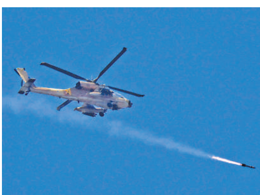
▲一架以色列「阿帕奇」攻擊直升機4日向黎南部發射導彈。