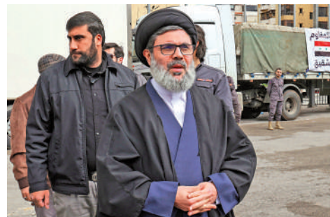
▲薩菲丁被視為已故真主黨領導人納斯魯拉的潛在接班人。