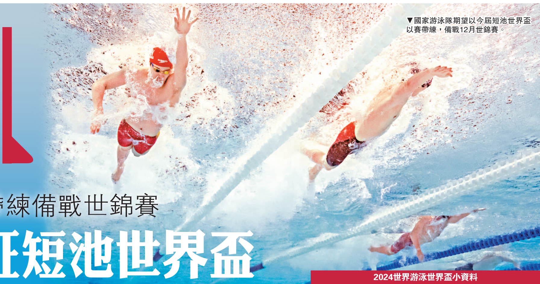
▼國家游泳隊期望以今屆短池世界盃以賽帶練，備戰12月世錦賽。