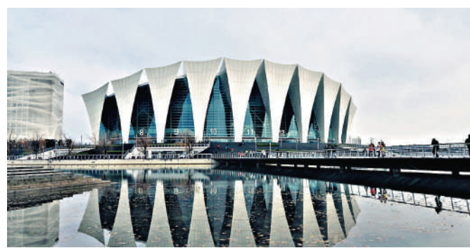
▼2024世界短池游泳世界盃上海站，將於東方體育中心游泳館進行。