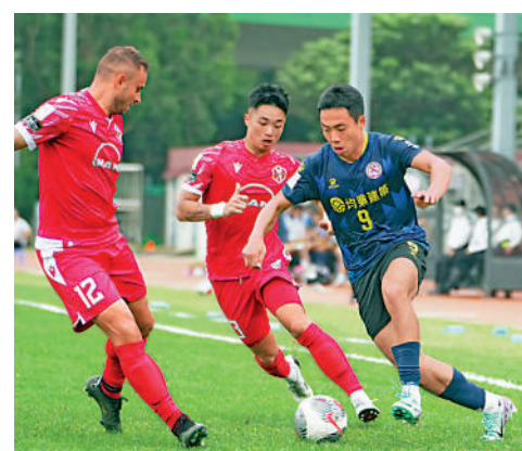
▲南區（紅衫）與北區（藍衫）今季港超未嘗一勝。

南區與北區於今季戰績相若，兩隊位列聯賽倒數2、3，並未嘗勝績。北區在上輪於主場被大埔以3：0大炒，南區亦於主場以0：2不敵爭冠球隊東方。雖然兩隊於聯賽積分相差僅一分，但從數據上看，南區4輪比賽共攻入3球失6球，反觀北區則是入5球失13球，故南區的攻防表現要比北區更勝一籌，相信主軍能在主場取勝。