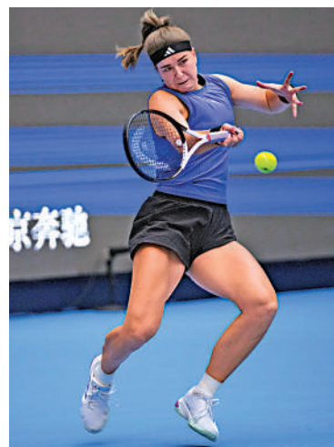
▲捷克球手穆楚娃（圖）以2：1爆冷擊敗頭號種子莎芭蓮卡。

鄭欽文賽後表示：「最開始的兩盤，我的精神沒完全提上來。直到說出第一個『Come on』，我感覺自己得到了力量，慢慢找回狀態。半決賽的對手穆楚娃很聰明，她今天能贏莎芭蓮卡很讓人意外，說明她狀態不錯。明天（今日）我會全力以赴，無論發生什麼。」