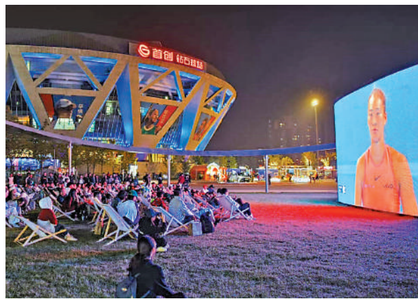
▲不少球迷在北京鑽石球場外的戶外座位觀看鄭欽文8強賽事。