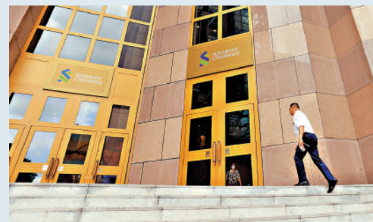
在一眾本地銀行股中，大摩預期滙控和渣打的表現會較佳。