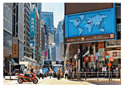
▲隨着訪港旅客增加，店舖租金有望回升。

期內仍有轉差風險，主要原因是業務比較集中在房地產身上的公司，也面對現金流錯配問題，以及難望在短期內出現明顯改善。