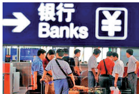
▲內地近期公布的其中一項金融支持措施，是向六大國有商業銀行注資。

瑞銀預期郵儲行（01658）、交行（03328）及農行（01288）將優先獲得注資，且注資規模相對較大，主要是這幾家銀行的普通股一級資本比率的緩衝空間較為有限。該行估算，每當提升1個百分點的普通股一級資本，郵儲行、交行及農行所分別需注入860億、900億及2210億元人民幣，H股股息率會減少0.6個百分點。