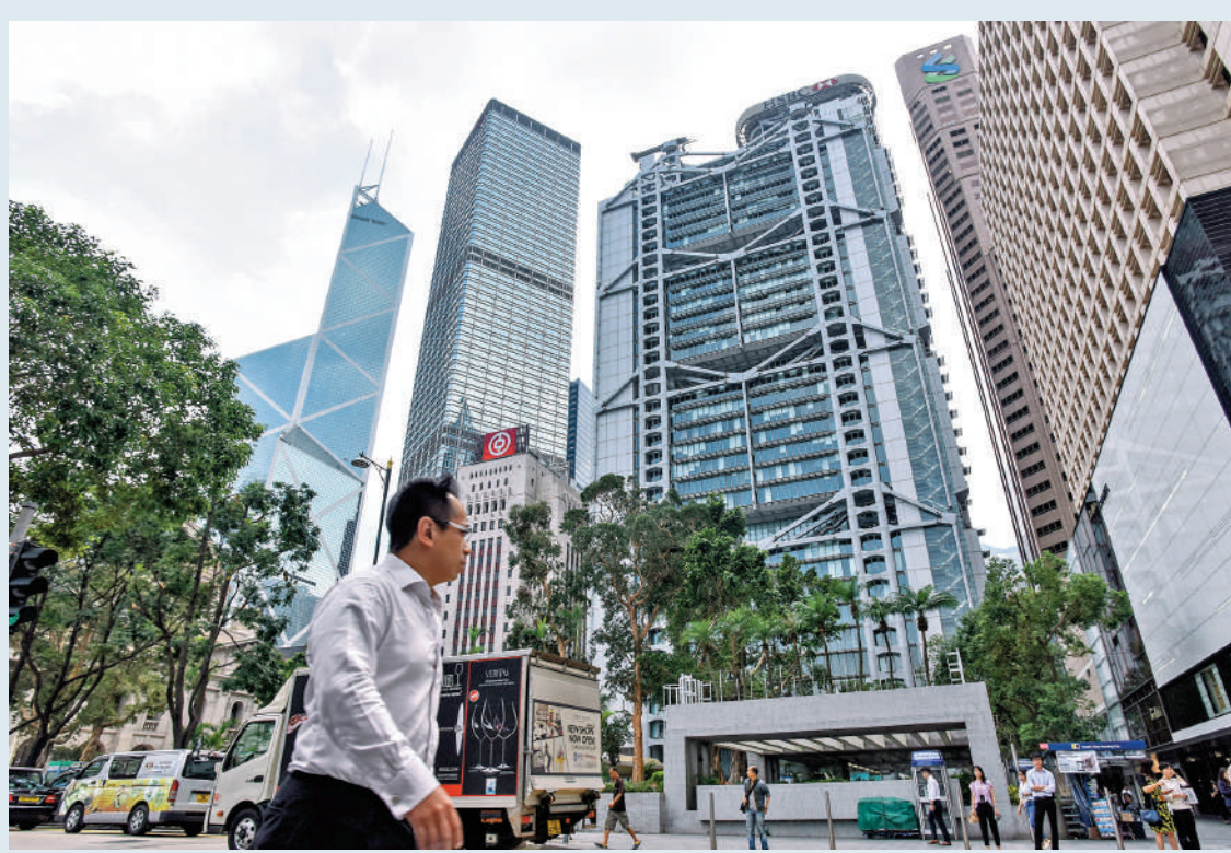
踏入減息周期，本地銀行雖然要面對淨息差收窄的壓力，但較低的息率料可吸引更多貸款。

在一眾銀行股之中，大摩相信，滙豐控股（00005）和渣打集團（02888）的表現有望優於恒生銀行（00011）和中銀香港（02388）。