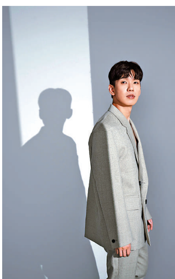
▲林奕匡擔任「港浪音樂會」特別嘉賓。

門票現於城市售票網（www.urbtix.hk）發售。查詢節目詳情，可電27342960，或瀏覽gbacxlo.gov.hk/tc/programmes/pop-kong。