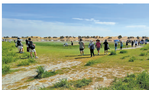
▲巴丹吉林沙漠形成獨特的生態系統。

巴丹吉林沙漠的旅遊價值。巴丹吉林沙漠是一個理想的旅遊和探險目的地，每年5月至10月是最佳旅遊季節，遊客可以體驗滑沙、沙漠越野、攝影等多種活動。2023年，巴丹吉林沙漠迎來超過51萬國內外遊客。沙漠周邊的海森楚魯風蝕地貌「怪石林」、6000多年歷史的曼德拉山岩畫以及胡楊林等，構成阿拉善沙漠世界地質公園的亮麗名片。