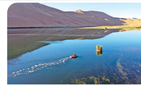
▲巴丹吉林沙漠「五絕」之神泉——音德日圖湖。

30多年來多次探訪巴丹吉林，並在《我的世界 沙漠之旅》一書中稱，「巴丹吉林沙漠是地球上最迷人的地方之一」。