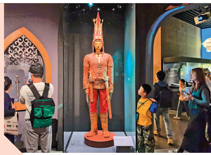
▲市民和遊客在天津博物館參觀「黃金武士與富饒草原——哈薩克斯坦國家博物館藏哈薩克斯坦歷史文物展」。