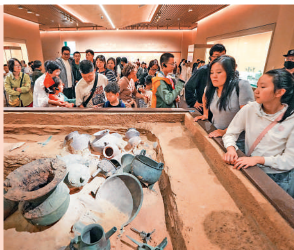
▲遊客在河南省安陽市殷墟博物館新館參觀。

今年國慶黃金周假期，「博物館熱」再次延續，全國多地博物館連日爆滿。北京、上海、重慶、天津、安陽等的博物館都人山人海，有推着嬰兒車的年輕父母，有打扮時髦的情侶，還有組團出遊的老人們，紛紛走進博物館感受文化魅力，充實假期生活。