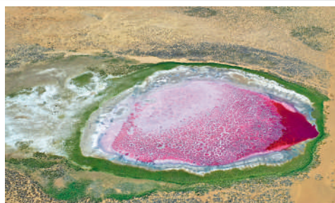
▲達格圖湖宛若沙漠之眼。

駱駝刺，它們將強大的觸角向着天空和沙漠深處無限地延伸；蜥蜴、蛇、駱駝、山鴿、鼯鼠、野兔，牠們在金色的黃昏裏自由地奔走；一望無際的沙漠裏還星羅棋布着140多個湖泊，滋養着大量飛禽走獸、草木蟲魚，更滋養着世代逐水草而居的牧民。