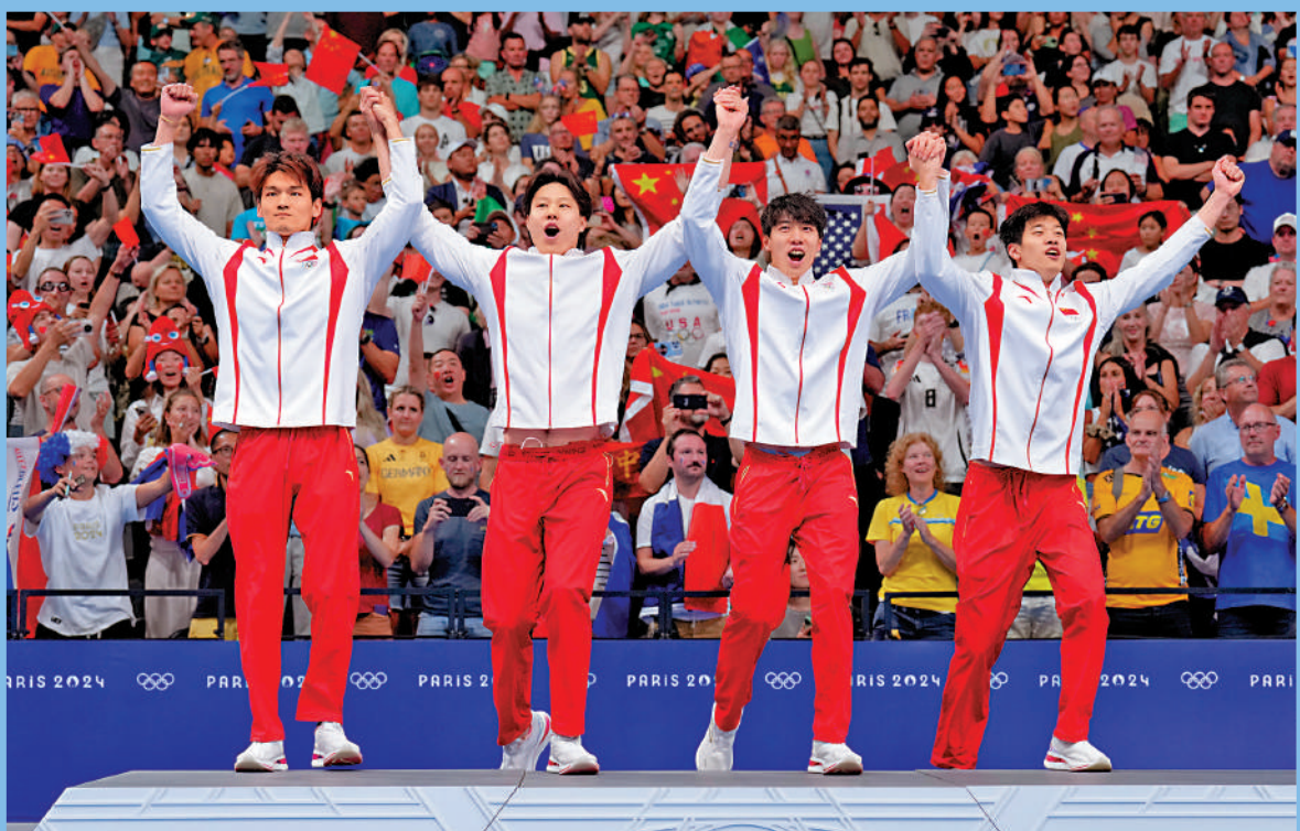
▲左起：徐嘉余、覃海洋、孫佳俊、潘展樂，攜手奪得巴黎奧運混合泳接力金牌。

除了人才覆蓋面不斷擴大外，中國男子游泳隊員的全面性也有明顯提高。運動員在青少年訓練階段並不局限於某一項目或泳姿的專項訓練，而是通過兼項訓練提升運動員的技術基本功和體能水平，為之後的專項訓練奠定基礎。潘展樂在主攻短距離自由泳之前，曾參加混合泳項目的全國比賽，目前他仍在全國游泳比賽中報名參加400米、800米等中長距離自由泳。400米和800米的訓練讓他擁有超出其他短距離運動員的有氧能力，這個優勢讓他在百米自由泳的最後25米能夠保持不掉速，這是他屢次在世界大賽上奪取冠軍的重要原因。