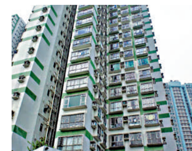
▲慧豐園有租客轉為買樓上車。

車。另消息指，元朗譽88第1座低層H室，實用面積477方呎，獲上車客以520萬承接，實用呎價10901元，原業主於2021年初斥640萬入市，賬蝕120萬或18.8%。