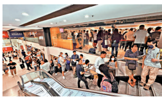
▲元朗尚柏昨日首輪發售98伙，折實價242萬元起，吸引大批買家捧場，該盤有指售出96伙。