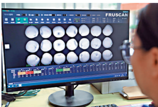
▲內地電商開始部署雙11促銷，相關板塊有上升潛力。

港股連日衝高，分析指出，大市短期仍有上升空間，但由於成交額連續三日減少，揭示動力有所減弱，散戶要警惕震盪風險。保守投資者可留意高息股滙控(00005)、中移動(00941)、中海油(00883)，較為進取的散戶，薦吸阿里巴巴(09988)，因為內地電商開始部署雙11，阿里有上升潛力。