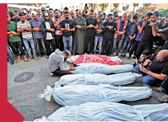
▲巴勒斯坦民眾6日在加沙中部哀悼遇難同胞。

當地時間5日晚至6日凌晨，以色列對貝魯特南郊發動逾30次空襲，遇襲地點包括加油站和存放醫療用品的倉庫，當地多個街區及貝魯特國際機場附近均被波及。據悉，這是近期以來貝魯特南郊經歷的最猛烈的夜間襲擊。6日，加沙中部代爾拜拉赫市的一座清真寺和一所學校亦遭到以軍轟炸，造成至少26人死亡、93人受傷。遇襲清真寺和學校皆用於收容因軍襲擊而流離失所的巴勒斯坦人，死傷者包括許多兒童。