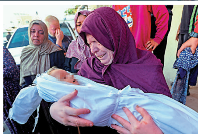
▲一名巴勒斯坦兒童在以軍對加沙中部的空襲中遇難。