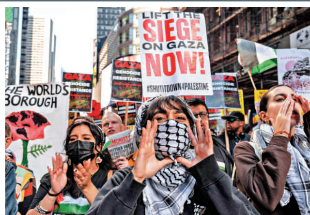
▲美國紐約5日舉行反戰示威，聲援加沙民眾和黎巴嫩民眾。

【大公報訊】國務院新聞辦公室6日公布消息，將於10月8日（星期二）上午10時舉行新聞發布會，請國家發展改革委主任鄭柵潔和副主任劉蘇社、趙辰昕、李春臨、鄭備介紹「系統落實一攬子增量政策 扎實推動經濟向上結構向優、發展態勢持續向好」有關情況，並答記者問。