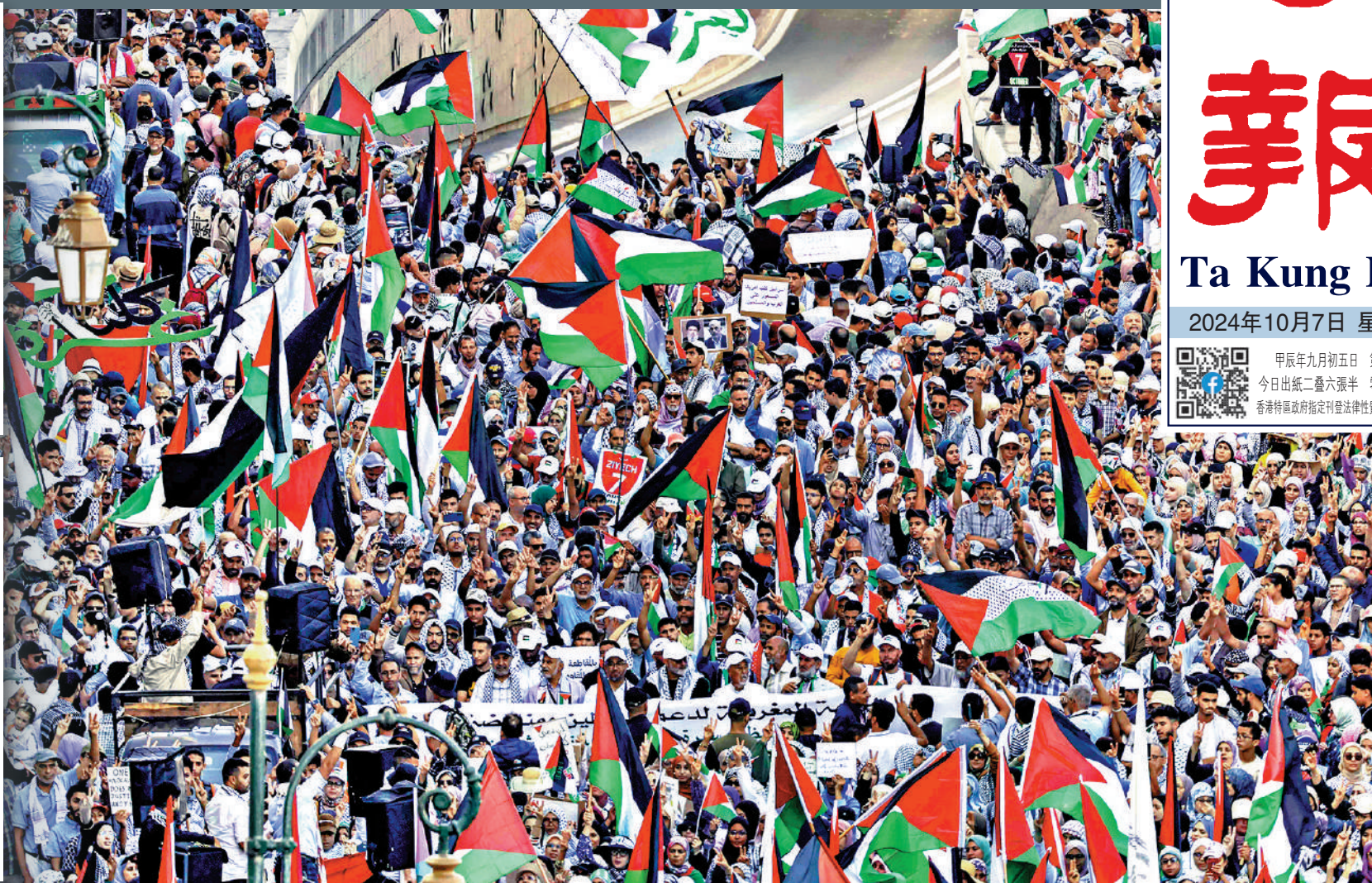
▲反戰示威者6日在摩洛哥舉行大規模集會，呼籲以色列停火。