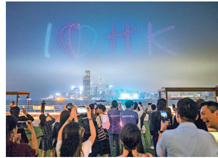
▲業界建議當局派發「夜間消費券」，令香港夜經濟再次興旺。

消費券上追加時限和地域限制，只限於晚上八時至早上六時前有效，且只可用於本地商戶。此舉可以為市民創造夜間在本地消費的需求，打破現時不在港消費的習慣，並能給予商戶在夜間經營的誘因，針對性地刺激消費市場，從而重塑本地的夜消費市場，令香港夜經濟再次興旺。