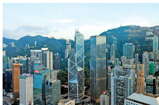
▲銀行間訊息共享平台(FINEST)去年6月推出以來，累計分享約300宗可疑個案，平均每個月分享20至30宗。