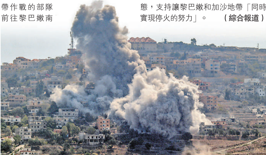
以色列空襲黎巴嫩南部城鎮，升起巨大煙霧。

與此同時，以色列不斷擴大對黎巴嫩的攻勢。以軍發言人7日證實，已派遣此前在加沙地帶作戰的部隊前往黎巴嫩南