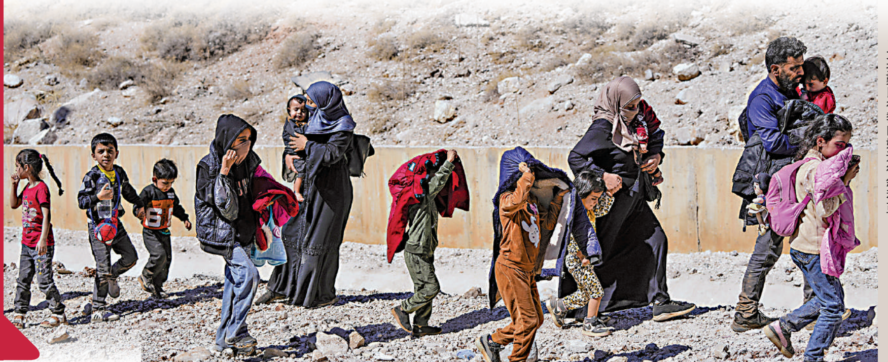
大批難民從黎巴嫩逃往敘利亞。

【大公報訊】毛寧稱，在各方共同努力下，已安排兩批次共215位中國公民分別搭乘輪船和包機，從黎巴嫩安全撤離，其中包括3位香港居民和1位台灣同胞。當前黎以局勢仍複雜嚴峻，中國駐黎巴嫩使館仍在堅守，將繼續指導協助少量留在當地的中國公民採取安全措施，保護自身安全。