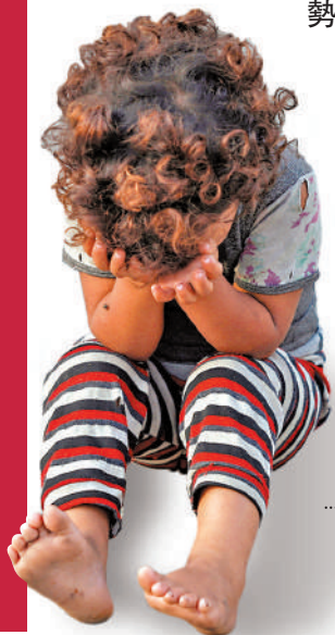
一名無家可歸的兒童坐在貝魯特街頭。

根據黎巴嫩公共衛生部最新統計，以色列上月下旬對黎境內擴大攻勢以來，黎巴嫩已有超過1400人死亡，約120萬人流離失所，另有超過40萬人逃往敘利亞，引發嚴重人道主義災難。BBC援引黎巴嫩前總理辛尼奧拉指出，黎巴嫩「已被國際社會遺棄」。中國外交部發言人毛寧8日表示，中方高度關注當前黎以緊張局勢，應黎巴嫩政府請求，中國政府決定向黎巴嫩提供緊急人道主義醫療物資援助，幫助黎方開展醫療救助工作。