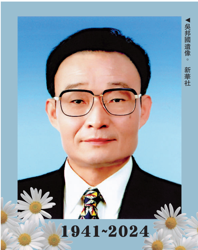
▲吳邦國遺像。

吳邦國同志是中國特色社會主義民主法治建設的重要領導者。在黨中央領導下，他將立法工作作為全國人大及其常委會的首要任務，堅持科學立法、民主立法，適應新形勢制定修改相關法律，集中開展法律清理工作。他擔任中央憲法修改小組組長，組織起草了憲法修正案草案，並由十屆全國人大二次會議通過。他主持制定修改反分裂國家法、物權法等一系列對中國特色社會主義事業發展具有重大影響的法律，為推動形成中國特色社會主義法律體系作出重要貢獻。他強調中國特色社會主義法律體系是動態的、開放的、發展的，必須隨着中國特色社會主義實踐的發展而發展。他強調人大工作必須堅持黨的領導。人大各項工作都要有利於加強和改善黨的領導，有利於鞏固黨的執政地位。這一點在任何時候都不能動搖。他堅持在新的起點上繼續加強和改進立法工作，探索開展立法後評估，不斷提高立法質量，推動憲法和法律有效實施。他高度重視人大監督工作，明確提出「圍繞中心、突出重點、講求實效」的監督工作思路，完善監督工作方式方法，有力推動了黨中央重大決策部署貫徹落實。他高度重視人大對外交往工作，堅持人大對外交往服從服務於國家外交大局，注重發揮人大對外交往的特點和優勢，全面加強與各國議會及多邊議會組織的友好關係，推動形成人大對外交往新局