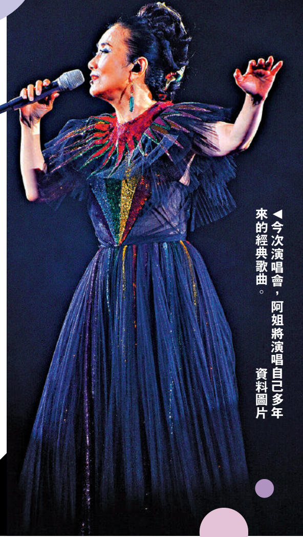
▲今次演唱會，阿姐將演唱自己多年的經典歌曲。資料圖片