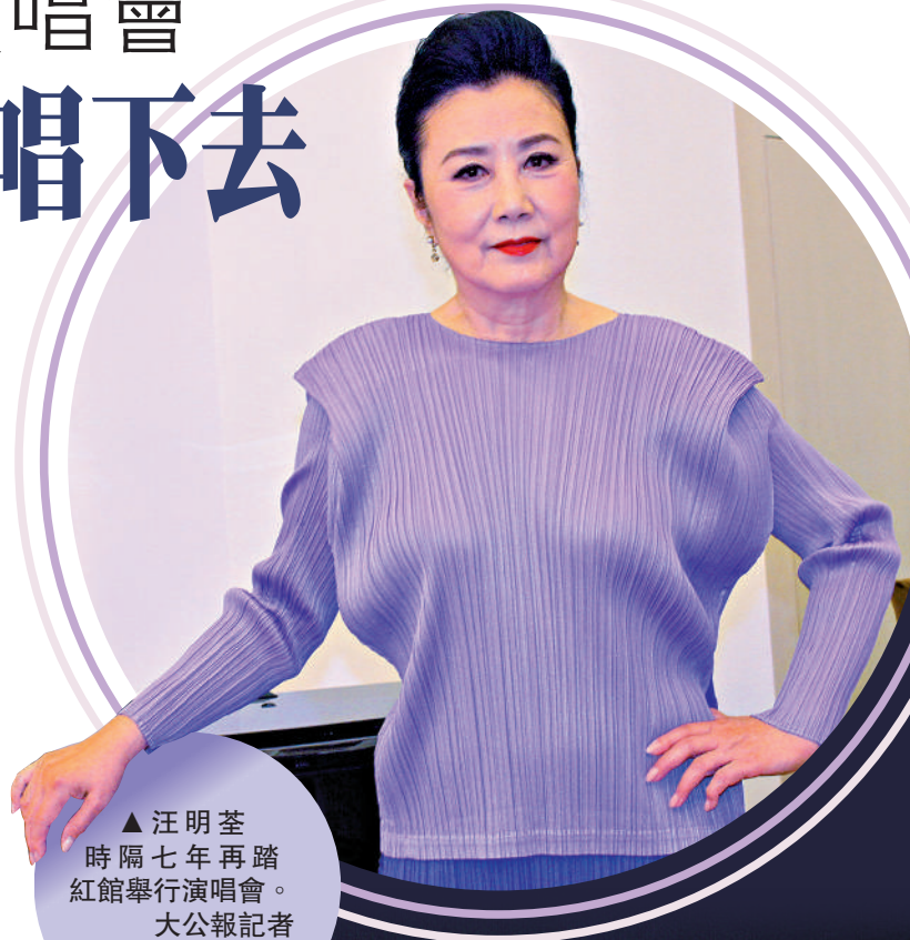
▲汪明荃時隔七年再踏紅館舉行演唱會。

可能到大灣區其他城市演出，上海及北京兩站亦在斟談中。她說：「我不適合做幾萬人那類很大的場，因為聲音控制不了。我想做一萬人以內的中場，但有些場地難預訂到，加上現在很多演唱會舉行，所以更難訂場。」提到啟德體育園明年將開幕，阿姐指那個場館太大了，但相信在那裏演出很有趣，適合世界級或頂尖歌手開唱，或是舉行球賽等國際盛事。相隔七年再度開騷，阿姐坦言很期待，因為自己很喜歡舞台。上一次在紅館開騷是她入行50周年，非常開心。她表示：「歌迷說我現在好像幾乎都演粵劇，演唱會卻沒有做，所以今次就趁自己還有力就去做啦！機會真係愈來愈少，年紀越來越大也會驚個台跳或者要穿高跟鞋等。現在鞋趯高些我會腳震，所以鄭秀文好嘢！對鞋7吋高，膝蓋要好用力，也會很傷膝蓋。」問到阿姐這次會否是最後一次舉行個唱？她說：「不會，就像我的新歌歌詞所寫，我希望可以做到一百歲、唱到一百歲，聽到觀眾的掌聲，我就很開心繼續唱。」