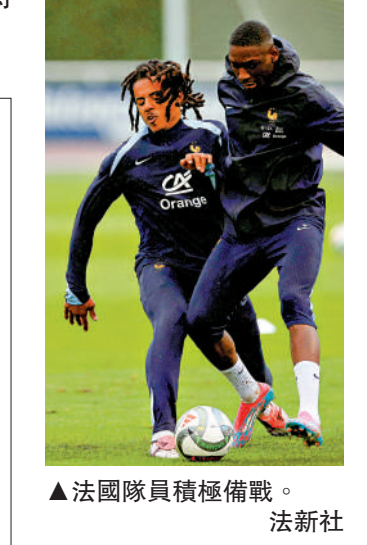
法國隊員積極備戰。

巴西阿根廷客場求反彈 出擊智利委內瑞拉 智利僅錄得1勝2和5負劣績，只比3和5負的榜尾秘魯好一點，目前實力已難再稱為南美勁旅，前線仍要靠34歲的伊度亞度華加斯入球，難以支撐大局。巴西意外地僅以3勝1和4負排名第5，不過晉級決賽周任務亦未見壓力，他們上仗作客0:1不敵巴拉圭，今仗正好反彈，洛迪高斯、拉芬夏比洛尼及新星安迪歷將大開殺戒。 另一場委內瑞拉主場對阿根廷明天凌晨5時開賽，主隊令人驚喜排名直接晉級決賽周的6位位置，肯定會踢得比較進取，奈何今仗遇正榜首阿根廷恐難逃一敗。阿根廷上仗被「二哥」哥倫比亞擊敗，錄得外圍賽第2場敗仗，僅以兩分之差保住榜首，今仗終於獲美斯傷癒復出，肯定聯同拿達路馬天尼斯、祖利安艾華斯、迪保羅等人爭勝博反彈，今場可買主客和的「客勝」。