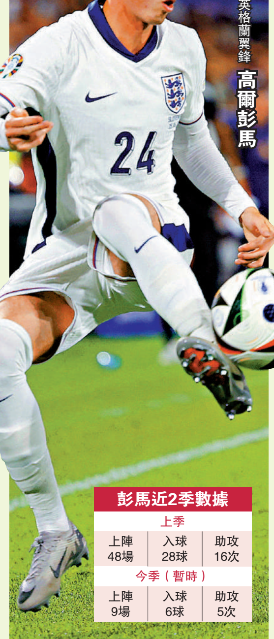
英格蘭翼鋒高爾彭馬