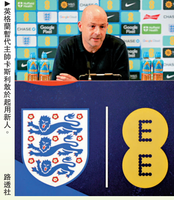
英格蘭暫代主帥卡斯利敢於起用新人。