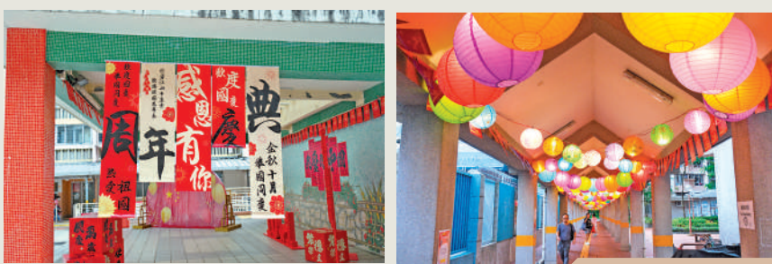
▲荃灣福來邨與天水圍天悅邨（右圖）成為雙冠軍。

由香港物業服務公司協會主辦的「齊齊扮靚幸福邨——香港公共屋邨慶祝中華人民共和國成立75周年社區裝飾比賽」，結果近日揭曉，出現雙冠軍賽果。天水圍天悅邨、荃灣福來邨的國慶布置裝飾，同時奪得冠軍。