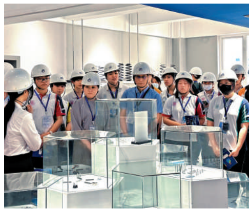
▲同學們到韶關鋼鐵廠，見證現代重工業的發展。

【大公報訊】記者趙宏報道：2024-2025香港高中學生「公民與社會發展科內地考察首發團（韶關）」啟動儀式，前日在「多彩韶關——工業文化園景區」舉行，來自保良局李城璧中學逾120名老師和學生，參加兩天一夜的韶關丹霞文化及經濟發展考察團。獲國家教育部、中央政府駐港聯絡辦教育科技部、廣東省教育廳等各單位的鼎力協助，令今年公民科內地考察順利開展。 同學們在行程中，參觀韶關鋼鐵廠，了解現代化重工業的發展情況，親身感受國家各方面的發展現況，體悟中華民族深厚的傳統文化底蘊，傳承愛國主義精神。隨後參訪世界文化遺產丹霞山，到博物館，也有科普生態講座，欣賞丹霞美景，了解丹霞地貌，了解文化遺產的保育與傳承。 本年度的公民科內地考察已經由上年度的26個行程增加至28個，其中18個為一至三天廣東省內行程，10個為四至五天廣東省外行程，本年度的新行程共有7個，其中江西省、江蘇省和山東省都是本年度新設計的行程。為配合愛國主義教育的推行，教育局亦增加相關的參訪點，以提高學生對民族的自豪感。