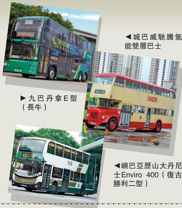
▲城巴威馳騰氣能雙層巴士