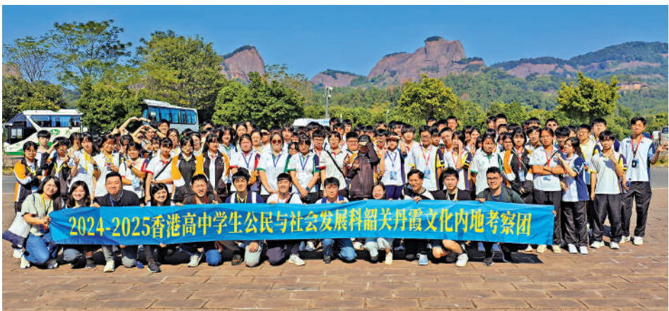
▲交流團參觀世界文化遺產丹霞山，了解文化遺產的保育與傳承。

【大公報訊】記者趙宏報道：2024-2025香港高中學生「公民與社會發展科內地考察首發團（韶關）」啟動儀式，前日在「多彩韶關——工業文化園景區」舉行，來自保良局李城璧中學逾120名老師和學生，參加兩天一夜的韶關丹霞文化及經濟發展考察團。獲國家教育部、中央政府駐港聯絡辦教育科技部、廣東省教育廳等各單位的鼎力協助，令今年公民科內地考察順利開展。 同學們在行程中，參觀韶關鋼鐵廠，了解現代化重工業的發展情況，親身感受國家各方面的發展現況，體悟中華民族深厚的傳統文化底蘊，傳承愛國主義精神。隨後參訪世界文化遺產丹霞山，到博物館，也有科普生態講座，欣賞丹霞美景，了解丹霞地貌，了解文化遺產的保育與傳承。 本年度的公民科內地考察已經由上年度的26個行程增加至28個，其中18個為一至三天廣東省內行程，10個為四至五天廣東省外行程，本年度的新行程共有7個，其中江西省、江蘇省和山東省都是本年度新設計的行程。為配合愛國主義教育的推行，教育局亦增加相關的參訪點，以提高學生對民族的自豪感。