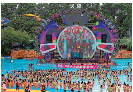
▲廣州將建超級樂園，構建「一心四園」格局。圖為廣州長隆水上樂園。

南部聯動公共開放的城市空間，提供文商旅體融合配套功能。中山大學港澳珠三角研究中心教授鄭天祥表示，隨著港珠澳大橋、南沙大橋、深中通道等陸續建成通車，珠江口兩岸1小時旅遊圈逐步成型，灣區各大主題樂園也可加強資源聯動，共建大灣區世界級旅遊目的地。