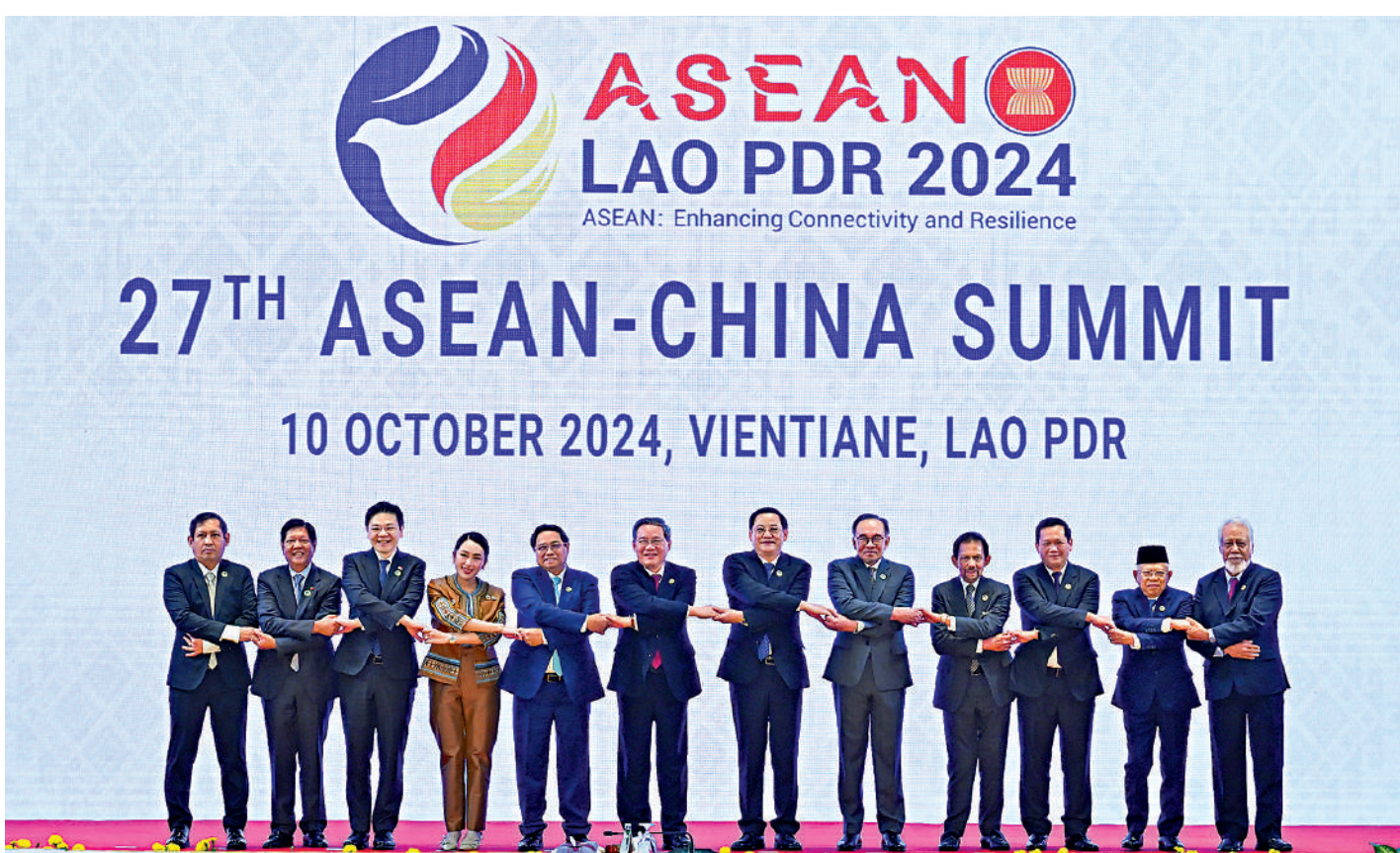
▲當地時間10月10日，國務院總理李強在老撾萬象出席第27次中國—東盟（10+1）領導人會議。這是會前集體合影。

雙方強調，3.0版在現有中國—東盟自貿協定和《區域全面經濟夥伴關係協定》（RCEP）基礎上實現重要增值，涵蓋數字經濟、綠色經濟、供應鏈互聯互通、標準技術法規與合格評定程序、海關程序及貿易便利化、衛生與植物衛生措施、競爭和消費者保護、中小微企業、經濟技術合作等領域。這些升級成果將全面拓展中國與東盟在新興領域互利合作，加強雙方標準和規制領域互聯互通，促進貿易便利化及包容發展。雙方確認將加快完成法律審核、國內程序等工作，推動2025年簽署升級議定書。