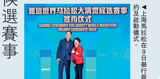
▲上海馬拉松在9日舉行簽約及啟動儀式。

賽事起點位於外灘金牛廣場，設馬拉松、健身跑和競速輪椅馬拉松三個項目，其中馬拉松和健身跑總參賽規模為38000人。今年馬拉松競賽規模有所擴大，由去年的20000人增至23000人，健身跑為15000人。此外，根據世界馬拉松大滿貫辦賽要求，2024上海馬拉松將增設競速輪椅馬拉松項目，參賽規模約20人。