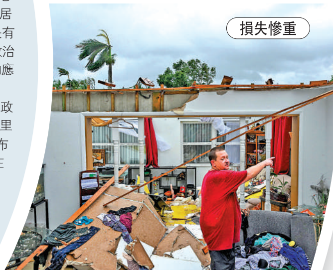
▲佛州一名男子的住所被狂風摧毀。