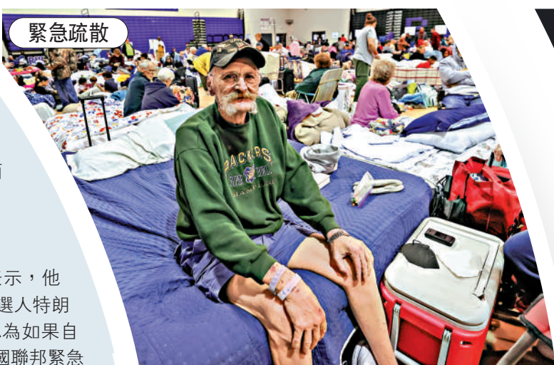
▲9日，佛州民眾在一所中學的體育場內躲避風災。

CNN稱，美國近二十年的「颶風政治」由兩場風災塑造。2005年「卡特里娜」颶風來襲，時任共和黨籍總統小布什應對不力，飽受批評，結果共和黨在2008年大選中落敗，奧巴馬成功上位。2012年，奧巴馬應對颶風「桑迪」的表現受到公眾認可，幫助他成功連任。《今日美國報》表示，民主黨總統候選人哈里斯希望「海倫妮」和「米爾頓」像「桑迪」一樣起到助選效果；特朗普則希望放大現任政府救災過程中的失誤，進而打擊民主黨選情。（綜合報道）