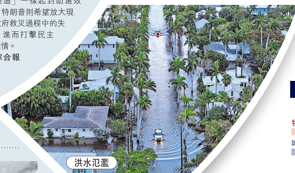
▲颶風「米爾頓」10日在佛州部分地區引發洪災。